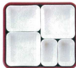
⑦ 仕切Lセット (①×2・③×1・④×2) ¥2,130