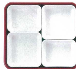
⑧ 仕切Mセット (③×2・④×2) ¥1,860