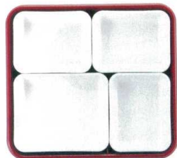
② 仕切Bセット (③×3・⑤×1) ¥1,950