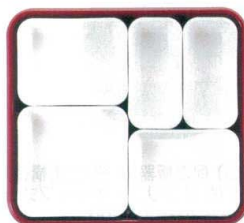
① 仕切Aセット (②×2・③×2・④×1) ¥2,120