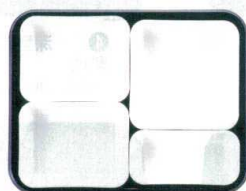
⑪ 仕切Tセット ②×1・③×2・④×1 ¥1,750