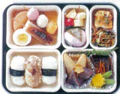
⑨ 仕切Qセット ⑨×2・③×3 ¥2,070