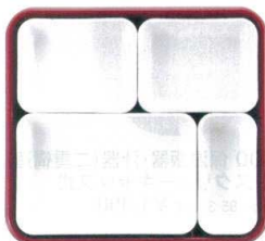
⑤ 仕切Eセット (②×1・③×2・⑥×1) ¥1,960