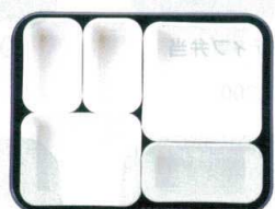
⑩ 仕切Sセット ⑨×2・②×1・③×1・④×1 ¥2,020