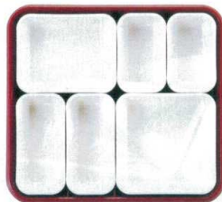
③ 仕切Cセット (①×2・②×2・③×1・④×1) ¥2,390