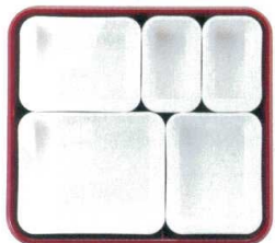
⑥ 仕切Fセット (①×2・③×2・⑤×1) ¥2,220