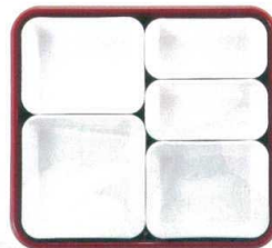
④ 仕切Dセット (②×2・③×2・④×1) ¥2,120