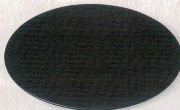
276-12-2E 11,000円 黒マツト尺2大皿 38×4.5cm