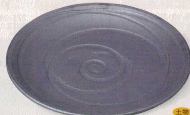
黒砂うず潮 276-8-45E 15,500円 12号皿 37.5×5.3cm 276-9-45E 7,800円 10号皿 32×4.3cm