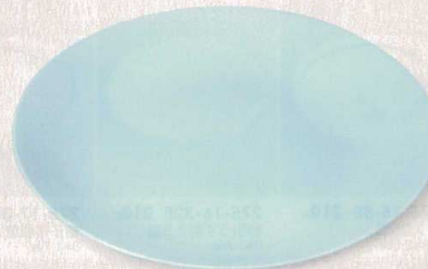
青磁 276-3-43E 18,500円 42cm大皿 41.7×5.7cm 276-4-43E 8,500円 36cm大皿 35.8×4.5cm