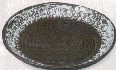
黒茶渦三ツ足 276-10-35E 14,000円 13.0皿 40×8cm 276-11-35E 4,200円 10.0皿 30.2×5.1cm