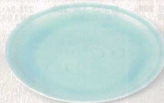
青白磁友禅彫丸 276-6-56E 17,000円 11.0皿 34.6×4cm 276-7-56E 12,400円 10.0皿 30.5×4.7cm