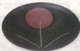
276-5-35E 8,200円 備前風草花文10.0皿 32.5×5cm