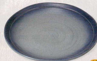
276-13-2E 10,000円 笠間量尺一大皿 34×3.8cm