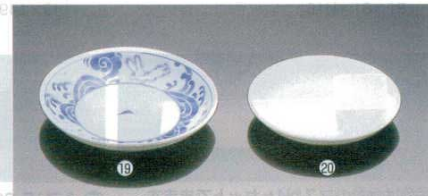
19 白波うさぎ 4寸皿 T03-108 (RTL-C5) 6-2159-1901 ¥860 φ129×H23 美濃焼