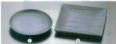
1 ソニック黒 小皿 T03-82 (RTL-A1) 6-2159-0101 ¥1,080 φ135×H20 美濃焼 2 ソニック黒 角小皿 T03-83 (RTL-A2) 6-2159-0201 ¥1,400 150×150×H15 美濃焼