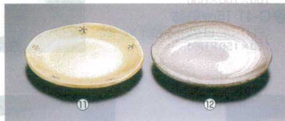
11 黄瀬戸印花4.0丸皿 T03-97 (RTL-B3) 6-2159-1101 ¥1,000 φ130×H15 瀬戸焼