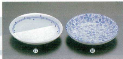
17 うみぶどう 4寸皿 T03-106 (RTL-C3) 6-2159-1701 ¥860 φ129×H23 美濃焼