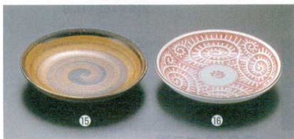
15 鉛斑点 4寸皿 T03-104 (RTL-C1) 6-2159-1501 ¥860 φ129×H23 美濃焼