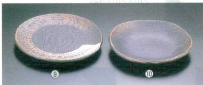
9 南蛮白刷毛5.0丸皿 T03-94 (RTL-A9) 6-2159-0901 ¥930 φ155×H20 瀬戸焼