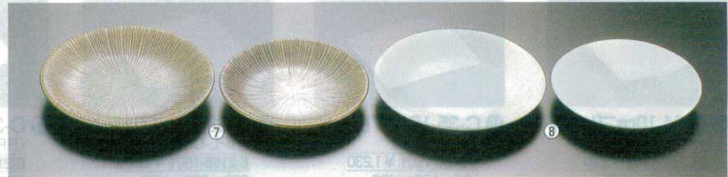
7 千段・織部 (RTL-A7) 6-2159-0701 T03-90 4.5皿 φ150×H20 ¥1,350 6-2159-0702 T03-91 4.0皿 φ130×H20 ¥1,050 美濃焼 8 千段・青磁 (RTL-A8) 6-2159-0801 T03-92 4.5皿 φ150×H20 ¥1,350 6-2159-0802 T03-93 4.0皿 φ130×H20 ¥1,050 美濃焼