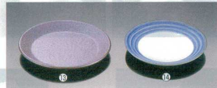
13 黒南蛮4.5丸皿 T03-98 (RTL-B5) 6-2159-1301 ¥1,250 φ140×H18 瀬戸焼