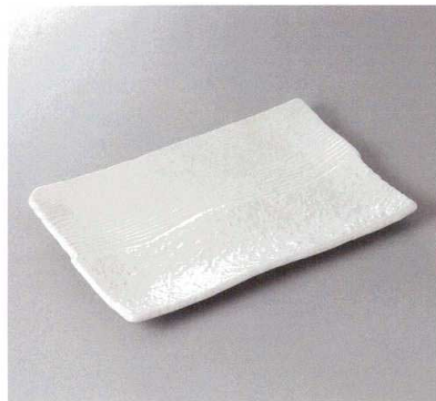
311-1-41F 2,750円 白楽長角大皿 32.5×21×3.5cm