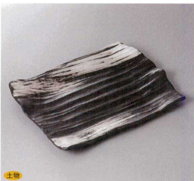
311-6-81F 2,500円 白刷毛10号長角盛皿 32×23×3cm