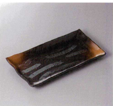
311-13-72F 1,800円 美濃黒備前櫛目長角皿 31.5×16.5×2.5cm