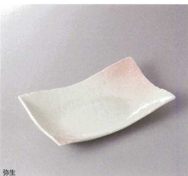
311-9-43F 2,100円 ソリ皿(大) 25.7×15×4.8cm 311-10-43F 980円 ソリ皿(中) 16.8×13×4.2cm