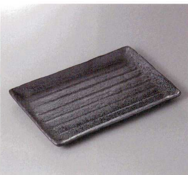
311-8-43F 2,400円 黒結晶新ホッケ皿(大) 33.5×21×2.3cm