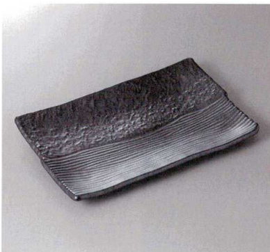
311-2-41-45F 2,750円 黒楽長角大皿 32.5×21×3.4cm