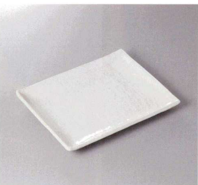
311-12-72F 1,900円 白均窯長角天皿 27.3×20.5×3cm