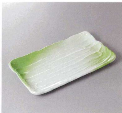
311-7-32F 2,420円 春夏秋冬荒ノ半33cmほっけ皿 33×18.5×2.8cm