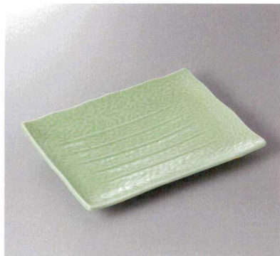
311-4-43F 2,550円 ヒスイタタキ角大皿 30.1×22.7×3.4cm