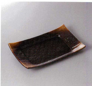
311-3-77F 2,600円 焼締やきしめ9.0長角四方皿 27.5×17×3.5cm