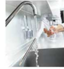
洗浄し何度でも使えるセンサー