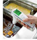
持ちやすいT字型筐体