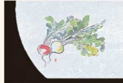
③ WH-3 かぶら 12月~2月 6399200 ¥4,500