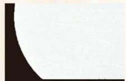
⑱ WHA-03 無地 オールシーズン 6423100 ¥3,500