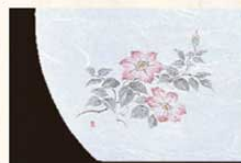
⑫ WH-12 鉄仙 6月~7月 6400100 ¥4,500