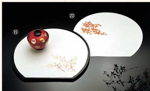
⑲ 桜 (2月~4月) 加 3273600 ¥3,000