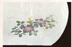
㉓ 鉄仙 (6月~8月) 加 3273800 ¥3,000