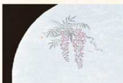
⑩ WH-10 藤 4月~5月 6399900 ¥4,500