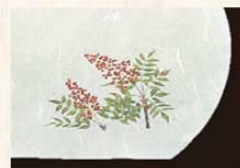
㉕ 南天 (12月~2月) 加 3274100 ¥3,000