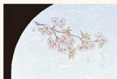
⑨ WH-9 桜 3月~4月 6399800 ¥4,500