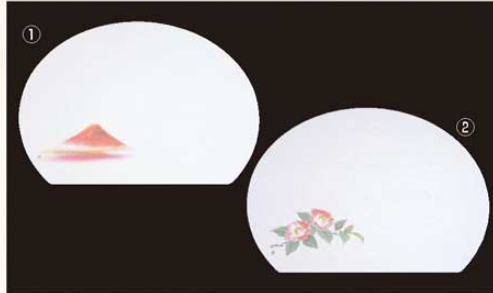
① WH-1 赤富士 オールシーズン 6399000 ¥4,500