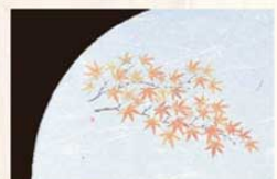
⑬ WH-13 もみじ 9月~11月 6400200 ¥4,500