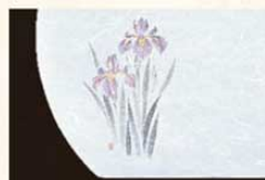
⑪ WH-11 あやめ 5月~6月 6400000 ¥4,500