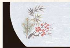
⑦ WH-7 松竹梅 1月 6399600 ¥4,500