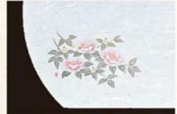
⑤ WH-5 山茶花 11月~1月 6399400 ¥4,500