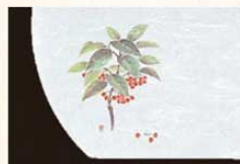
⑥ WH-6 万両 12月~1月 6399500 ¥4,500