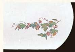
㉔ 山ぶどう (8月~10月) 加 3273900 ¥3,000