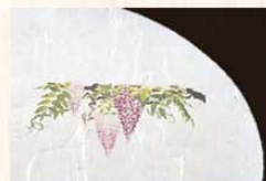
㉒ 藤 (4月~6月) 加 3273700 ¥3,000