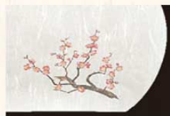
㉑ 梅 (1月~3月) 加 3273500 ¥3,000