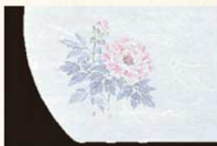
⑮ WH-15 ぼたん 4月~5月 6400400 ¥4,500