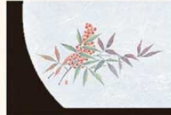
④ WH-4 南天 12月~2月 6399300 ¥4,500