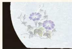
⑯ WH-16 朝顔 7月~8月 6400500 ¥4,500