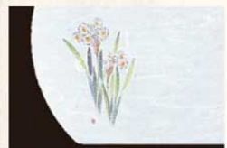
⑧ WH-8 水仙 11月~1月 6399700 ¥4,500