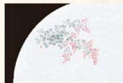
⑰ WH-17 萩 9月~11月 8023000 ¥4,500