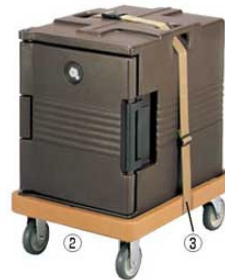
*写真はカムキャリアUPC400のをせ、専用ストラップで固定した例です。