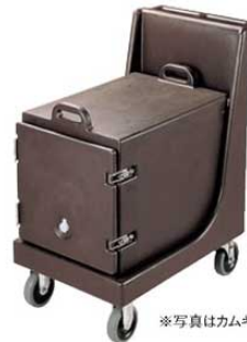
*写真はカムキャリアをのせた使用例です。