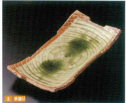
20603-308 伊賀灰釉渦巻長角皿(手造り) 8,000円 20入 (34×16.5×4.5cm)