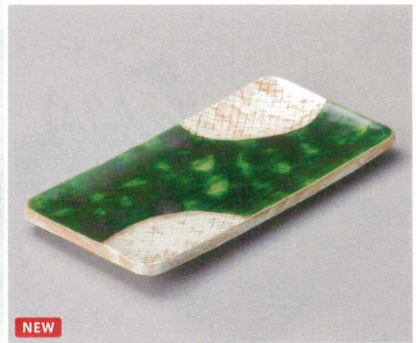
20609-138 志野織部まな板皿 4,500円 12入 (34.7×17.5×3cm)