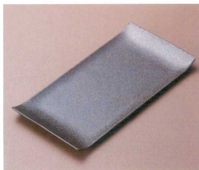
20610-418 玄武長角大皿 4,500円 30入 (32.6×16×2.1cm)