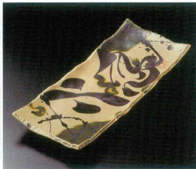
20608-148 織部徳れの字長角皿 4,800円 20入 (37×15.8×3.8cm)