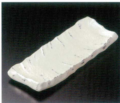
20605-178 粉引拭取りガタ彫12.0皿 5,250円 15入 (37×14.5×4cm)