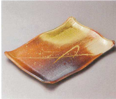
20602-668 古信楽12.0長角皿(信楽焼) 8,360円 10入 (35.5×24.5×3cm)