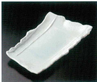
20607-318 青白磁ちぎり変形尺1寸皿 4,900円 10入 (33.5×20×4.5cm)