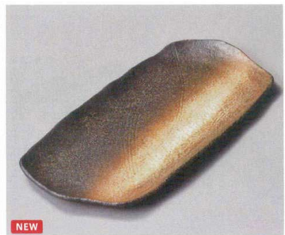
20612-468 黒備前変形ほっけ皿 2,150円 24入 (36×16.7×2cm)