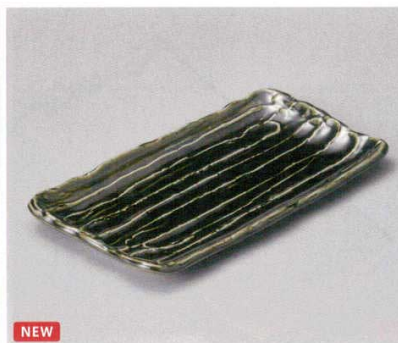
20611-578 荒ソギ織部33cmほっけ皿 2,300円 20入 (33.5×18.4×2.5cm)