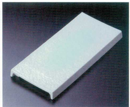
20606-258 青磁尺2寸長角皿 5,250円 40入 (36×15.8×3cm)