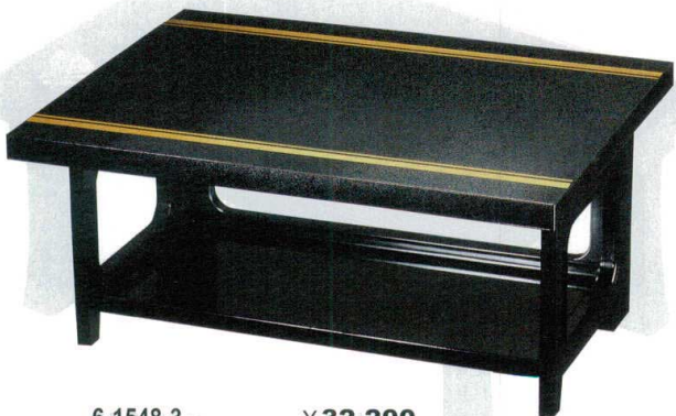
6-1548-3 ¥32,200 新飛龍膳 金ライン 黒タタキ [A] 650×500×300 5-1316-3