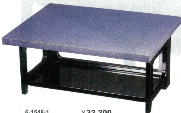
6-1548-1 ¥32,200 新飛龍膳 バイオレットパール [A] 650×500×300 5-1316-1