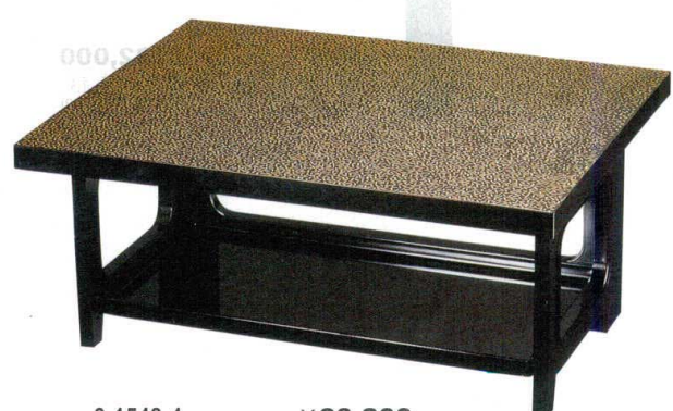
6-1548-4 ¥33,200 新飛龍膳 金ちらし [A] 650×500×300 5-1316-4