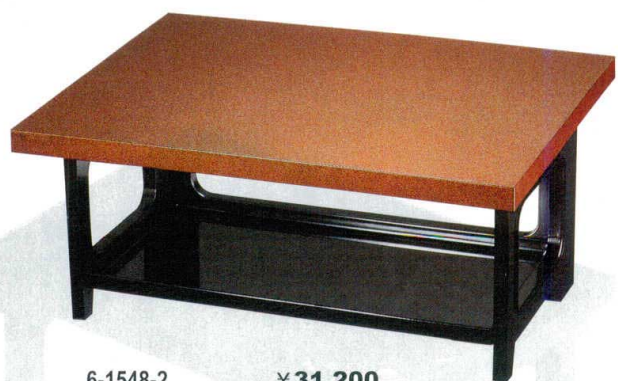
6-1548-2 ¥31,200 新飛龍膳 梨地塗 [A] 650×500×300 5-1316-2