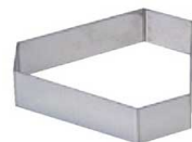
18 三角B型 (WDB-73) 内