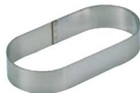
16 小判型 (WDB-64) 内