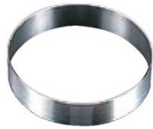
2 18-8 丸型セルクル (WSL-29) 目