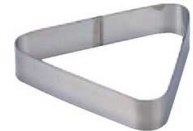
19 三角C型 (WDB-74) 内