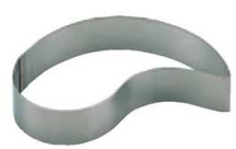
15 コンマ型 (WDB-65) 内