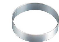
1 アルミ トルテリング (WTL-28)