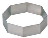
13 八角型 (WDB-67) 内