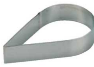
14 ティアドロップ型 (WDB-66) 内