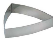
17 三角A型 3106-22 (WDB-70)