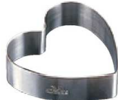
3 18-8 ハート型セルクル PP-632 (WSL-30) 目