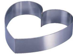
4 18-8 ウェディングケーキ用リング (NLV-13)