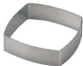
12 正方A型 (WDB-68) 内