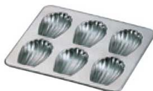
⑫ 18-8 マドレーヌ シェル型 PP-643

〈WMD-31〉 7-1039-1101 ¥2,200 269×228×H13 (1ヶ当たり 内40×57×H12) ⑨～⑪ 材質:スチール・フッ素樹脂加工