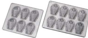
⑭ シリコン加工 貝型天板 (WTV-B7)

〈WMD-38〉 7-1039-1301 ¥1,400 270×228×H13 (1ヶ当たり 内40×56×H12) 材質:スチール・クロームメッキ