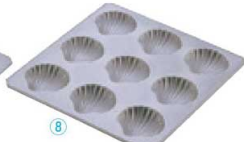
⑧ 9P No.5248

〈WMD-42〉 7-1039-0701 ¥1,500 200×190×H17 (1ヶ当たり 内46×77×H16) 材質:アルミニウム・フッ素樹脂2コート