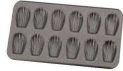
⑥ ゴベル マドリネット 12ヶ取 264710 〈WGC-41〉 7-1039-0601 ¥4,900 395×227×H17 (1ヶ当たり 内47×77×H16) 材質:スチール・フッ素樹脂加工