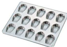
⑬ ギリア マドレーヌ シェル型 15ヶ取 No. 909

〈WMD-41〉 7-1039-1201 ¥1,800 200×200×H17 (1ヶ当たり 内46×80×H16)