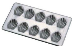
⑯ シリコン加工 マドレーヌ 貝型 10ヶ取 No. 148

〈WMD-33〉 7-1039-1501 ¥1,400 189×198×H15 (1ヶ当たり 内47×75×H14) 材質:プリキ・シリコン加工