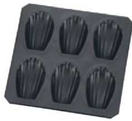
① マトファ マドレーヌ6ヶ取 310730 (フッ素加工) 〈WMD-04〉 7-1039-0101 ¥7,480 190×200×H16 (1ヶ当たり 内45×77×H15)