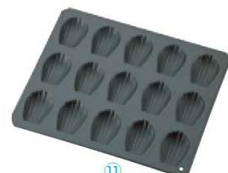
⑪ 15ヶ取 No. 5084

〈WMD-29〉 7-1039-1001 ¥2,000 248×254×H17 (1ヶ当たり 内63×63×H16)