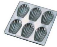
⑮ シリコン加工 マドレーヌ 貝型6ヶ取 No. 147

7-1039-1401 6ヶ取 218×238×H17 ¥5,500 (1ヶ当たり 内49×76×H16) 7-1039-1402 8ヶ取 218×300×H17 ¥7,000 (1ヶ当たり 内49×76×H16) 材質:プリキ・シリコン加工