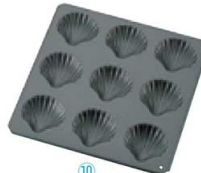
⑩ 9ヶ取 No. 5046

〈WMD-30〉 7-1039-0901 ¥1,500 189×199×H17 (1ヶ当たり 内46×77×H16)