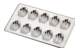
⑱ プリキ マドレーヌ 貝型 10ヶ取 No. 119

〈WMD-36〉 7-1039-1701 ¥1,000 189×198×H15 (1ヶ当たり 内47×75×H14)