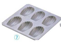
⑦ アルプリット マドレーヌシェル型 6P No.5247

〈WMD-42〉 7-1039-0701 ¥1,500 200×190×H17 (1ヶ当たり 内46×77×H16) 材質:アルミニウム・フッ素樹脂2コート