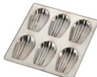
⑰ プリキ マドレーヌ 貝型 6ヶ取 No. 104

〈WMD-32〉 7-1039-1601 ¥1,250 210×125×H11 (1ヶ当たり 内30×40×H10) 材質:プリキ・シリコン加工