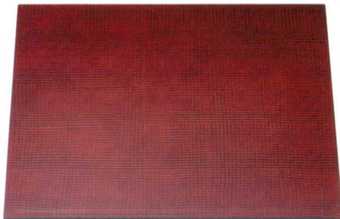
3-296-01 1101928 【A】尺1寸角敷膳 溜格子裏黒乾漆塗 ¥5,800 318×318×H6 櫃50