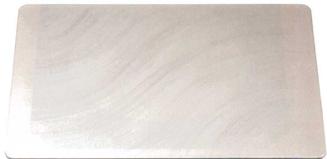
3-296-07 1101934 【A】尺4.5寸長角敷膳 銀波刷毛目裏黒乾漆塗 ¥10,500 437×329×H5 櫃40