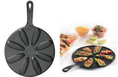
③ペッパーポッパーパン 71

全長:215 材質:PA66 ●割れやすいハードシェルタコスの具を詰めるのに適したサービングツールです。