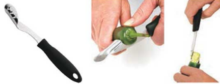
①ハラペーニョカッター 71