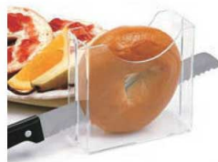
⑪ベーグルホルダー 71

外寸:230×145×H115 容量:約1,134ml 材質:ステンレス、ABS ●電源:単2電池1本(別売)