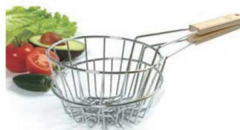
⑤トルティーヤフライヤーバスケット 71