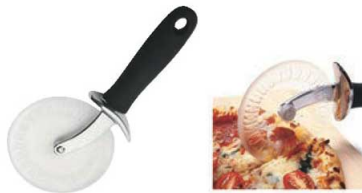
⑧ポリピザカッター 71

外寸:350×90×H20 材質:PC、TPRハンドル ●刃がポリカーボネートのため、テフロンで使用しても傷がつかないです。