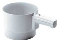
⑩バッテリーシフター 71

全長:235 材質:ステンレス、PP ●トルティーヤやチーズ、野菜などをおしゅれにカットできます。