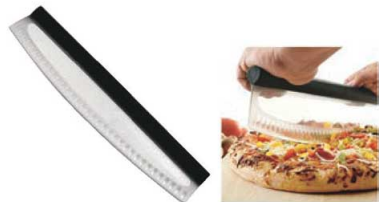
⑦ピザ/デザートスライサー 71

外寸:535×120×H50 材質:クロム鋼、コム ●タコスを最大5つ同時に運べます。