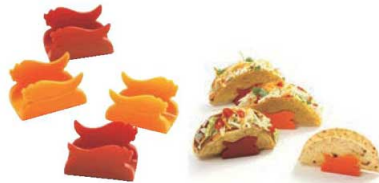
④タコスアミーゴス 4pc 71

外寸:355×230×H40 材質:鋳鉄(シーズニング済み) ●ハラペーニョポッパーを揚げずに作れるフライパンです。ピーマンの肉詰めにも。