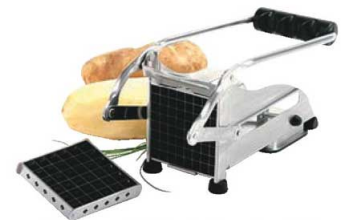
⑫フライドポテトカッター 71

外寸:115×120×H45 材質:アクリル、プラスチック ●キレイに半分にかつしにくいベーグル、ドーナツなどに最適です。 ※写真の包丁は別売です。