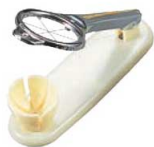
⑥玉子切器 縦型 (6分割)