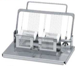
①18-8 横割二連 エッグカッター