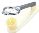
⑦玉子切器 縦型 (2分割 1本線)