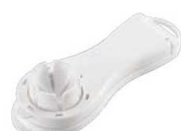
縦切りエッグカッター