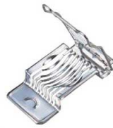
③玉子切器 ステンレス(8本線)