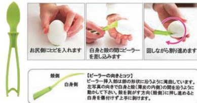
⑬リンデンヨナス PP エッグピーラー