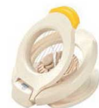
⑤エッグスライサー