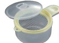
⑰サンドイッチ用 玉子メーカー