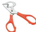
⑯うずらカッター ブッチ