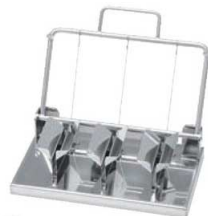
②18-8 縦割三連 エッグカッター