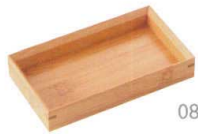
08 BB アメニティートレー 08 (52078) 3,000円 約16×9×H3cm ※材質:竹