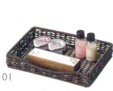
01 PP アメニティートレー 01 (49556) 2,200円 約22.5×16×H4cm ※材質:ポリプロピレン ※アメニティはイメージです。