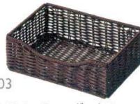
03 PP アメニティークラス 03 (49543) 3,000円 約22.5×16×H8cm ※材質:ポリプロピレン