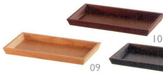
WM 洗面コップトレイ (2個用) 09 (52079) クリアー 3,900円 10 (52080) ブラウン 4,100円 約19.1×10.3×H1.6cm ※内寸:約17×8×H1.2cm ※13~17に使用できます。 11 (52081) ブラック 4,100円