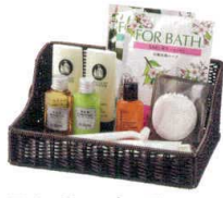
02 PP アメニティークース 02 (49542) 4,700円 約23×16×H11(5)cm ※材質:ポリプロピレン ※アメニティはイメージです。