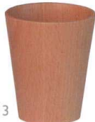
洗面コップ 13 (52086) ビーチ 約φ8×H9.5cm クリアー塗装 2,000円 14 (52087) メープル 約φ8×H9.5cm クリアー塗装 2,000円

Natural Wooden Tableware & Kitchen TOUGEI CO.,LTD 有限会社 藤 堂