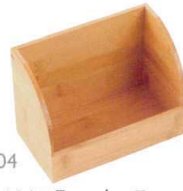
04 BB アメニティークース 04 (49545) 6,000円 約16.2×9.2×H12cm 内寸:約11.9×15.4×H0.9cm ※材質:竹