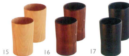
WM 洗面コップ (1個売り) 15 (52083) クリアー 約φ6.5×H10cm 材質:ひのき材 2,200円 16 (52084) ブラウン 約φ6.5×H10cm 材質:ひのき材 2,400円 17 (52085) ブラック 約φ6.5×H10cm 材質:ひのき材 2,400円