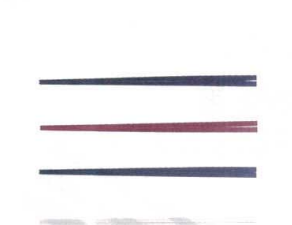
11 中華箸 ノーマル 23cm (1膳入) [OHSI-74] 洗 黒 13-0826-1101 ¥330 朱 13-0826-1102 ¥330 緑 13-0826-1103 ¥330 アイボリー 13-0826-1104 ¥330 全長:230 材質:PBT樹脂 耐熱温度:140°C