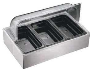
④EBM エレガント サラダステーション

外寸:540×360×H235 トレイ内寸:450×250 材質:トレイ/D7ステンレス(18Cr-3Ni-2.5Cu) ロールカバー/下皿/ポリカーボネイト ●付属のアイスボックス(2個付)を完全に凍らせてトレイの下に入れてご使用ください。冷たさを長時間保てます。