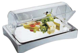
⑤18-10 コールドbuffet ㊦