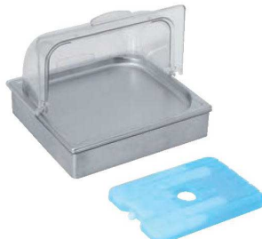
②EBM エレガント アイスディスプレイセット2/3

外寸:535×332×H250 材質:本体/18-8ステンレス トレイ/D7ステンレス(18Cr-3Ni-2.5Cu) ロールカバー/下皿/ポリカーボネイト ●電気を使わないアイスディスプレイセットです。デザートや海鮮盛り込みに最適です。 ●付属のアイスボックス(2個付)を完全に凍らせてトレイの下に入れてご使用ください。冷たさを長時間保てます。