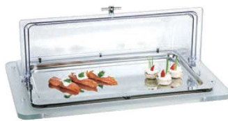
⑥アクリル コールドbuffet 角型 ㊦

外寸:565×360×H270 材質:カバー/アクリル プレート/ウォーターバン/ベース/18-10 ※保冷器2個付