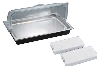
③SXアイスディスプレイセット (G/N)

外寸:370×370×H250 材質:本体/18-8ステンレス トレイ/下皿/18-8ステンレス ロールカバー/ポリカーボネイト ●付属品:アイスボックス 2-1136-0203 7493640 ¥550 1個付 ●電気を使わないアイスディスプレイセットです。デザートや海鮮盛り込みに最適です。 ●付属のアイスボックスを完全に凍らせてトレイの下に入れてご使用ください。冷たさを長時間保てます。