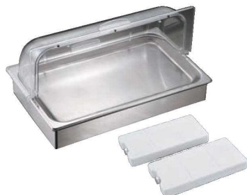
①EBM エレガント アイスディスプレイセット