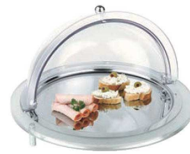
⑦アクリル コールドbuffet 丸型 ㊦

外寸:610×380×H260 材質:カバー/ベース/アクリル プレート/ウォーターバン/18-10 ※保冷器2個付