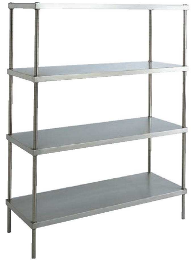
材質：棚板/SUS304(18-8)ステンレス 板厚/1.2mm 柱/SUS304 φ25 1.2mm厚 表面仕上：棚板/Aアールライン仕上 柱/#400ヘアライン仕上

特長 フラットな形状、メッシュシェルフと併用できる 同一寸法、電気的特性、耐薬品性 段耐荷重：80～100kg(均等荷重) キャニオンシェルフは、スペースに合わせて柱、棚板の サイズ、棚板の枚数をご指定ください。