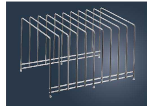
⑬ EBM 18-8 G/Nパンカバー & マナ板スタンド