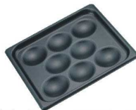
② ヴォラース アルミノンスティック エッグパン 71