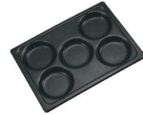
③ アルミ 目玉焼きプレート (テフロン加工) 77