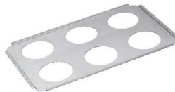
⑤ ヴォラース アルミノンスティック 親子パン専用 6穴プレート 73