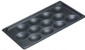
① ヴォラース アルミノンスティック エッグパン 71