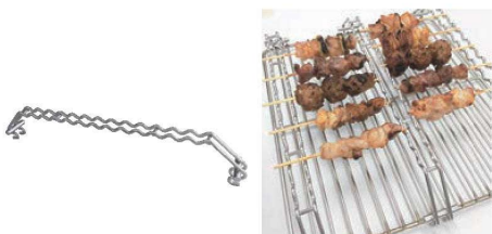
⑫ 18-8 バーベキューブリッジ 73