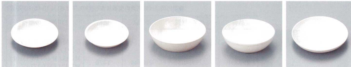
57-KI 14.5cm深皿(アイボリー) 144×24 ¥370 78-MI 13.5cmケーキ皿(アイボリー) 134×25 ¥390 163-GI 深皿(アイボリー) 159×42 530cc ¥550 TK-170 ¥480 175 楳 198頁 A-2I 菜皿(アイボリー) 148×45 590cc ¥430 P-300NI ¥390 174 楳 198頁 A-1I パン皿(アイボリー) 179×30 ¥470 296-OP ¥450 170 楳 198頁

新商品 病院・福祉 和風の器 洋風の器 中華風の器 汁椀無地食器 井・楳井 皿・ハ・皿・特・高 ヒラ・子・物・葉 箸・カ・ト・ラ・リ テ・ア・ル・ア・テ・ム 弁・当・配・食 漆器 強化磁器 ト・レ・イ・お・盆 子・ど・も・食・器 ホ・テ・ル・ワ・ッ・ズ