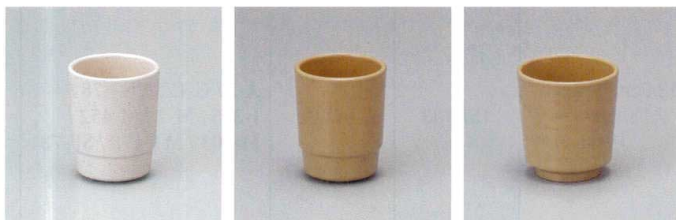
G-363Z 段付湯呑(石焼) 75×93 250cc ¥730 G-363E 段付湯呑(益子) 75×93 250cc ¥730 G-362E 長湯呑(益子) 84×90 320cc ¥660