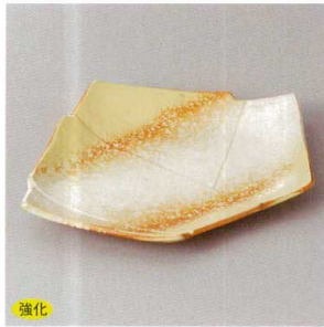
強化 213-13-73H 1,940円 春結晶結び皿 21.2×14.7×2.8cm