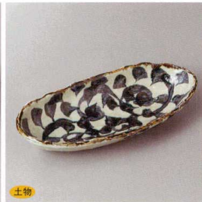
土物 213-7-23H 2,250円 夕コ唐草精円前菜皿 22.7×10.2×3.7cm