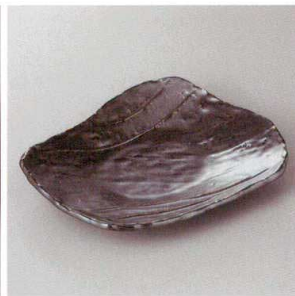
213-19-26H 1,800円 鉄結晶荒瀬型 前菜皿 20×16×3cm