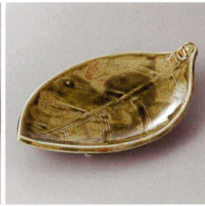
213-11-10H 2,040円 織部ライン流し葉型向付 22.5×13.5×5cm