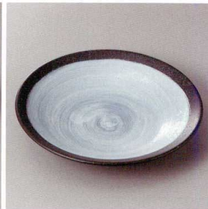
213-4-35H 2,200円 銀彩爛し黒6.5深皿 19.5×3.7cm