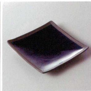
213-20-71H 1,800円 紺結晶6.0正角皿 17.5×17.5×2.1cm