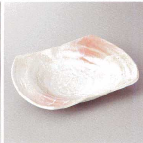
213-8-60H 2,100円 桜志野野両切長鉢 25.5×18×5cm