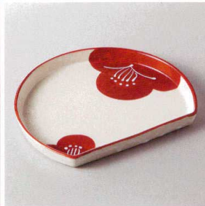
213-2-51H 2,250円 染付赤絵梅一珍半月皿 19×16.2×2cm