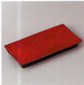
213-1-22H 2,250円 紅黒炭レーセル(小) 20.7×10×2.8cm