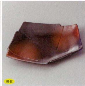
強化 213-16-77H 1,800円 黒彩結び皿 21×15×2.8cm