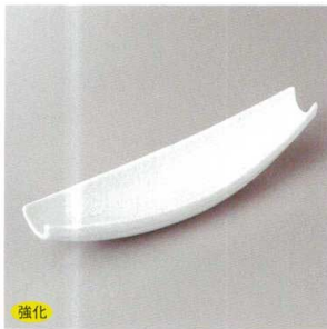
強化 213-17-22H 1,800円 白袖舟型前菜皿 23.2×6.2×4.5cm