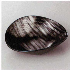
213-14-10H 1,860円 カスリ銀彩夕円向付 16.5×15×5cm