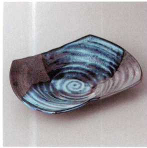
213-9-60H 2,100円 清流雨切長鉢 25.5×18×5cm