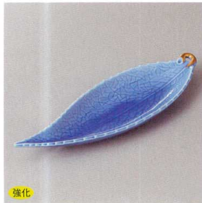
強化 213-5-5H 2,180円 コバルト木の葉皿 22.8×7.2×2.6cm