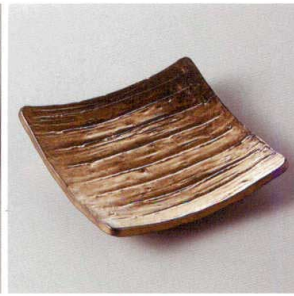
213-12-48H 2,000円 金彩 四足5.5正角皿 16.5×16.5×3.2cm