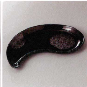
213-3-1H 2,300円 天目なるとまが玉皿 28.5×15×2.2cm