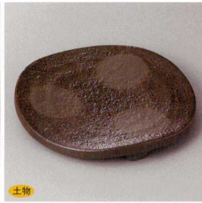
土物 213-10-21H 2,350円 炭化土丸6.0皿 18.5×2.4cm