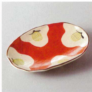
213-18-21H 1,800円 手描椿三つ足構円皿 21.2×15.5×4cm