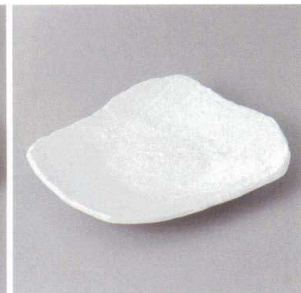
214-20-33H 1,350円 白釉砂目前菜皿 20.5×17×3.5cm