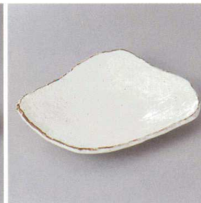
214-19-22H 1,400円 測サビ巻粉引荒瀬前菜皿 21×17×4cm