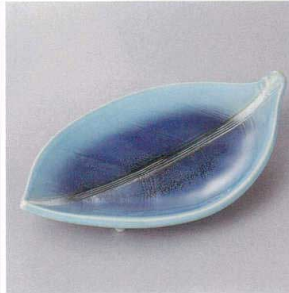
214-2-10H 1,680円 水辺足付向付 21.5×11.7×3.6cm