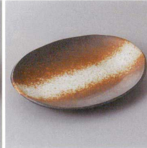
214-7-77H 1,570円 黒備前T楕円皿(中) 22×17×3.3cm