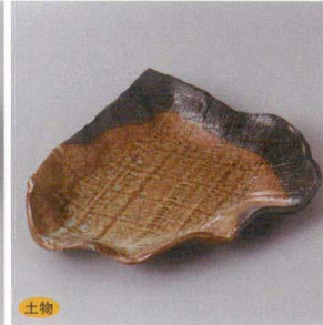
土物 214-3-23H 1,850円 武山タタラ皿 21×17×4cm