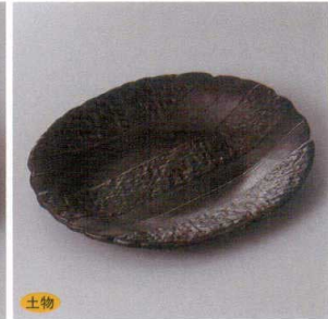
土物 214-12-45H 1,550円 黒釉石目楕円盛皿 23cm 23×19.5×2.8cm