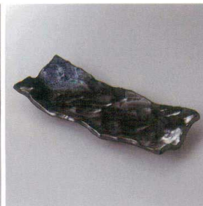
214-18-1H 1,400円 オーロラ波オーダブル皿 28.5×12×4.5cm