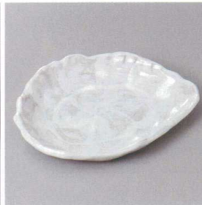
214-14-71H 1,500円 うのふ変型和皿 19.5×15.5×2.8cm