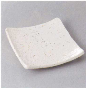
214-9-56H 1,560円 うのふ5.5角皿 16.5×16.5×4cm