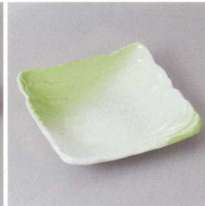
214-15-32H 1,670円 春夏秋冬飛ノギ17cm中鉢 17×17×3.5cm