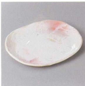
214-17-23H 1,550円 桜志野タタラ皿大 21×16.8×2cm