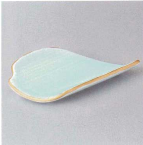
214-5-22H 1,600円 青磁変形笹形前菜皿 21.5×10.5×4.5cm