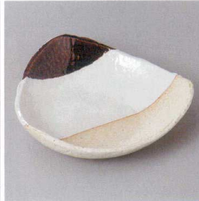
214-6-71H 1,600円 アメ塗分三角取皿 16.5×16.5×4.2cm