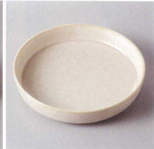
214-4-25H 1,600円 シルバーフォームM 16.4×3.4cm