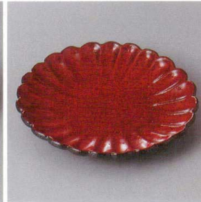
214-11-23H 1,700円 紅黒炭菊彫り中皿 16.8×3cm