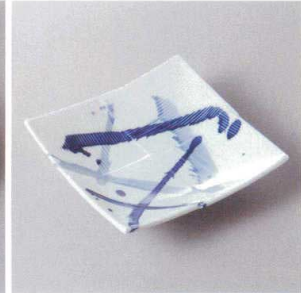
214-8-27H 1,560円 呉須飛ばし筋入5.0寸角皿 16×15.5×3.8cm