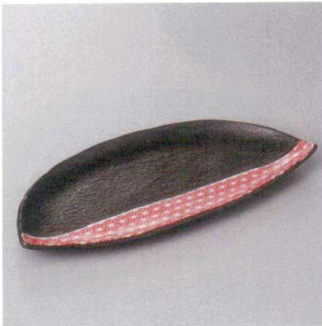
214-1-77H 1,780円 黒水晶赤切り9寸半月皿 27×12.2×2.5cm