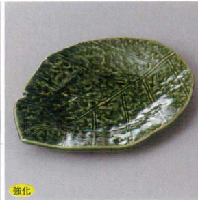
強化 214-10-5H 1,560円 織部袖葉型皿 20.5×15.5×2.4cm