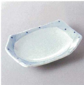
214-13-77H 1,500円 朝なぎ前菜皿 21.7×15.2×3.2cm