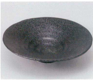
陶 26-401-522 1,960円 渡佐見焼 南蛮 平鉢 (15.8×4.3) 802420152