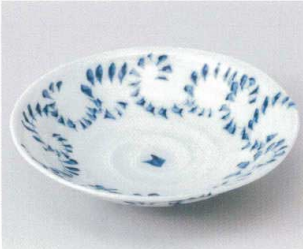
陶 26-201-252 2,100円 粉引刷毛槽円向付 (16.2×15×3.8) 503820325