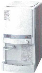
① RW-187BH ウォータークーラー (18L冷温水兼用) ¥107,000 f