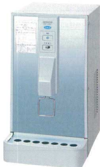
卓上温水器仕様表