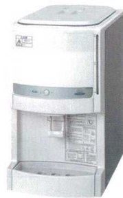
④ RW-128B ウォータークーラー (12L冷水専用) ¥85,000 f