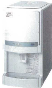
③ RW-187B ウォータークーラー (18L冷水専用) ¥92,000 f