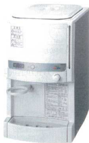
② RW-127BH ウォータークーラー (12L冷温水兼用) ¥97,000 f