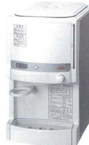
⑤ RW-142P ウォータークーラー (冷水専用・水道直結) ¥82,000 f 冷水供給能力:約10/11L/h