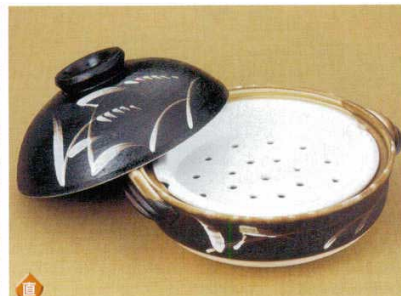
50514-645 嵯峨野9号むし鍋 (萬古焼) 9,400円 4入 (33.5×φ28.5×19cm)