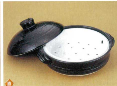
50515-645 黒袖らせん9号むし鍋 (萬古焼) 9,000円 4入 (32.5×φ28×18.5cm)