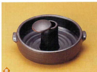
50516-655 鉄結晶しゃぶしゃぶ鍋 (萬古焼) 9,000円 4入 (29×φ26.5×13cm)