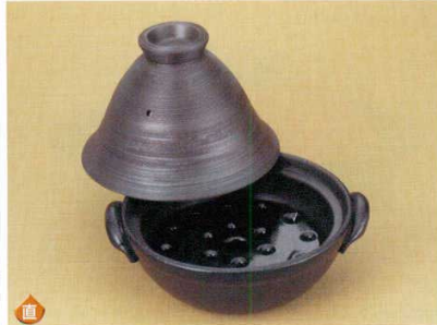
50503-655 鍋道楽7.5号蒸し鍋 (中子付) (萬古焼) 9,500円 4入 (26×φ23×20.5cm)