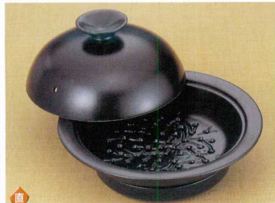
50507-275 スチームクッキングプレート 18,000円 12入 (26.4×16cm)