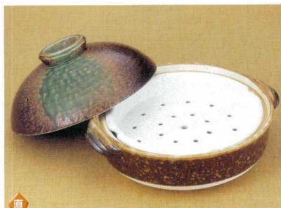
50513-655 南蛮織部むし鍋 (萬古焼) 9,400円 4入 (31×φ28.5×19cm)