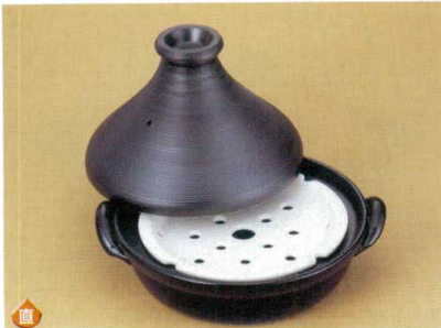
50501-655 蒸きげん10号蒸し鍋 (中子付) (萬古焼) 14,000円 4入 (34×φ30.5×21.5cm) 50502-655 蒸きげん8号蒸し鍋 (中子付) (萬古焼) 9,800円 4入 (28×φ25×19.5cm)