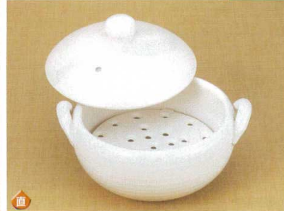
50504-655 白釉7号蒸し鍋 (中子付) (萬古焼) 5,800円 8入 (25×φ21×16cm)