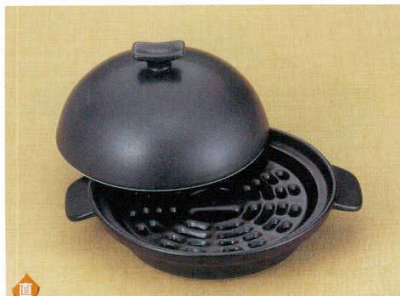
50505-655 ブラックスチーマー (中サナ付) (萬古焼) 5,200円 8入 (26×φ21.3×13cm) 50506-655 中サナのみ (萬古焼) 1,200円