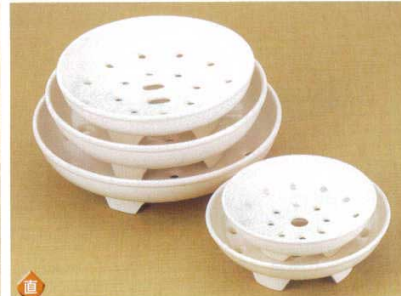
50508-645 10号鍋用高台むし器 (萬古焼) 4,700円 12入 (25.8×7.5cm) 50509-655 9号鍋用高台むし器 (萬古焼) 3,400円 (23×7.5cm) 50510-645 8号鍋用高台むし器 (萬古焼) 2,700円 24入 (20.3×6.5cm) 50511-655 7号鍋用高台むし器 (萬古焼) 1,800円 (18×5.5cm) 50512-645 6号鍋用高台むし器 (萬古焼) 1,700円 30入 (14.9×4.8cm)