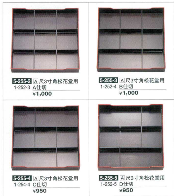
5-255-2 A 尺3寸角松花堂用 1-252-3 A仕切 ¥1,000