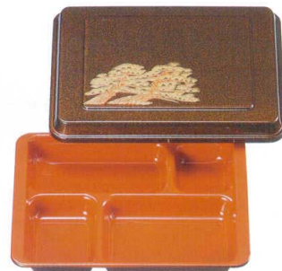
5-411-1 1-417-1 Aニューランチ副食入れ 梨地二色松身内朱 ¥1,950 (21.8×17.1×5.2) 梱60