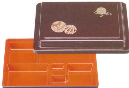
5-411-8 A尺1寸長手フレッシュ弁当 溜パールまり内朱 ¥3,700 (34×24.9×7.1) 梱20