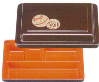
5-411-3 1-417-5 A8寸長手フレッシュ弁当 溜パールまり内朱 ¥2,000 (24.9×17.7×6.7) 梱40