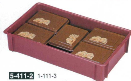
5-411-2 1-111-3 P.PNo.4 コンテナ ブラウン ¥2,900 外寸(68×40×13.5) 内寸(63.7×36.3×12.4) 梱10