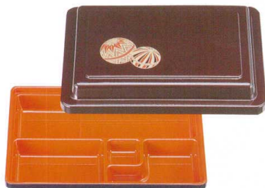
5-411-6 A9寸長手フレッシュ弁当 溜パールまり内朱 ¥2,500 (28×19.2×6.8) 梱40