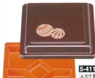
5-411-4 1-417-6 A8寸角フレッシュ弁当 溜パールまり内朱 ¥2,250 (24×24×6.6) 梱40