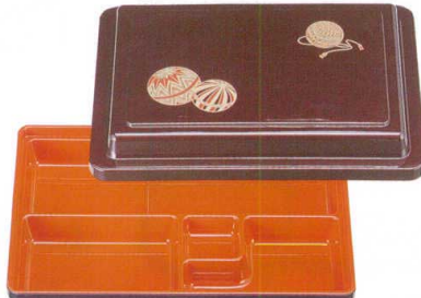
5-411-7 A尺0寸長手フレッシュ弁当 溜パールまり内朱 ¥2,900 (31.1×22.1×7.1) 梱20