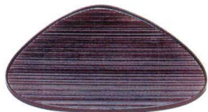
5-815-6 1-727-5 木はまぐり皿 溜 ¥4,000 (25.4×18.8×0.8) 梱60