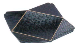
5-815-18 木木瓜四方天皿 金ライン 1-727-16 ¥3,100 (22.4×22.4×3) 梱50