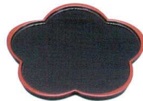
5-815-12 1-727-10 木(大)梅型盛皿 黒天朱 ¥3,700 (22.3×23.5×9.8) 梱50