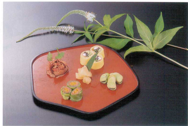
5-815-5 木9寸梅型皿 朱天黒 M-13-26 ¥4,200 (28.3×24.5×1.2) 梱50