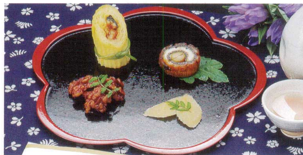
5-815-11 1-727-9 木(小)梅型盛皿 黒天朱 ¥1,800 (13.9×13.9×0.8) 梱100