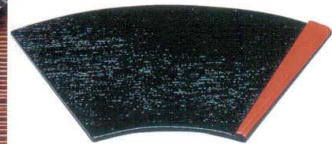
5-815-9 1-727-8 木(大)目はじき扇面皿 黒淵朱 ¥3,800 (34.5×21.5×1.3) 梱30