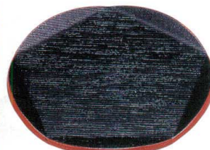
5-815-15 1-727-12 木(大)五角盛皿 黒天朱 ¥3,750 (27.5φ×1.3) 梱50