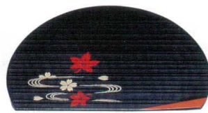
5-815-2 1-727-2 木8寸半月千筋スミ折皿 春秋 ¥1,600 (24.2×17.7×1) 梱60