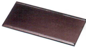
5-815-1 1-727-1 木アユ皿 溜 ¥1,800 (24.3×12.2×1.2) 梱80