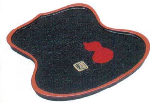
5-815-13 1-727-11 木(小)ひょうたん皿 ¥1,950 (15.2×14.5×1) 梱70