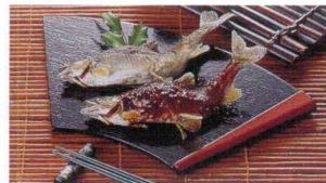
5-815-8 1-727-7 木(中)目はじき扇面皿 黒淵朱 ¥2,400 (30.7×17.5×1.2) 梱50