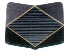
5-815-14 1-727-15 木(小)四方天皿 金ライン ¥2,100 (13.7×13.7×2.3) 梱100