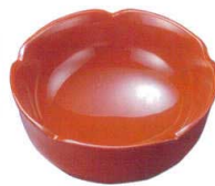
5-815-4 木梅鉢 朱漆 C-3-5 ¥900 (11φ×4.6) 梱100