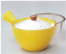
34813-607 黄さくらU付平急須 3,400円 (200cc) (有田焼)