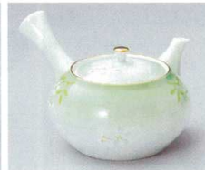
34825-607 花あかり中急須 3,100円 (350cc) (有田焼)