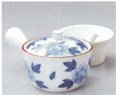
34818-607 有田焼 牡丹セラ急須 3,100円 (300cc) (有田焼)