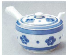
34811-607 ゴス巻梅Mジャンボ急須 2,850円 (500cc) (有田焼)