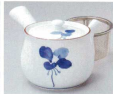
34805-607 まんりょうU付特大急須 2,850円 (550cc) (有田焼)