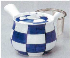
34808-607 濃市松U付特大急須 2,850円 (600cc) (有田焼)