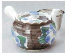
34822-607 墨山茶花U付中急須 2,500円 (450cc) (有田焼)