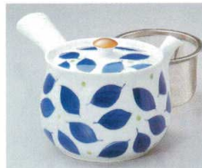
34806-607 木の葉U付特大急須 2,850円 (550cc) (有田焼)