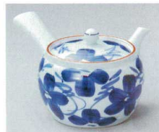
34826-607 染花紋M急須 2,600円 (350cc) (有田焼)