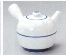
34830-607 夢路M中急須 2,200円 (400cc) (有田焼)