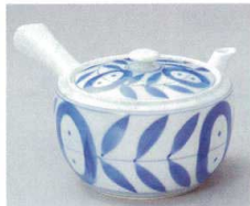
34812-607 廻り花M特大急須 2,850円 (500cc) (有田焼)