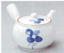
34828-607 まんりょう中急須 2,200円 (350cc) (有田焼)