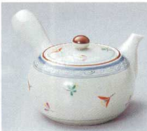
34824-607 花小紋M中急須 2,800円 (350cc) (有田焼)