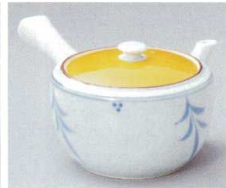
34810-607 黄釉内草花M特大急須 2,850円 (500cc) (有田焼)