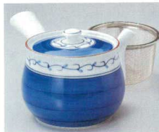
34801-607 桔梗唐草 MS特大急須 3,000円 (600cc) (有田焼)