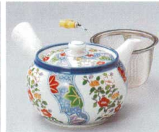
34820-607 花流水PP中急須 2,450円 (400cc) (有田焼)