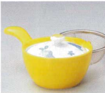
34819-607 釉彩うさぎU付平急須 2,800円 (300cc) (有田焼)