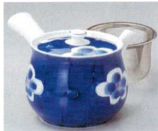
34807-607 梅香U付特大急須 2,850円 (550cc) (有田焼)