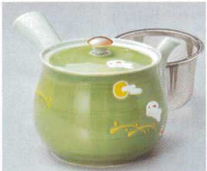
34803-607 兎斗屋U付特大急須(緑) 2,950円 (550cc) (有田焼)