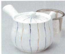
34802-607 麦わら十草 MS特大急須 3,000円 (650cc) (有田焼)