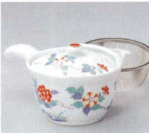
34814-607 花鳥U付マービー急須 3,500円 (250cc) (有田焼)