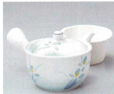
34817-607 一珍ランセラ急須 3,100円 (300cc) (有田焼)