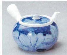
34827-607 濃葉彩中急須 2,450円 (400cc) (有田焼)