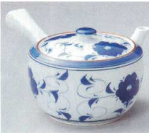
34809-607 藍染唐草Mジャンボ急須 2,850円 (500cc) (有田焼)