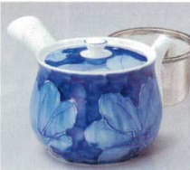
34804-607 濃葉彩(U)付特大急須 2,850円 (550cc) (有田焼)