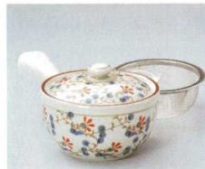
34816-607 錦草花U付雀口中急須 3,200円 (200cc) (有田焼)