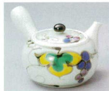
34821-607 豆彩ぶどうM中急須 3,200円 (350cc) (有田焼)