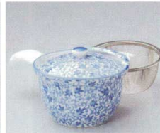
34815-607 花唐草U付マービー急須 3,200円 (250cc) (有田焼)