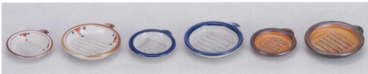
377-301-027 820円 赤絵ミニオロシ皿 (8.7) 539110102 377-302-027 880円 赤絵オロシ皿(小) (10.7) 539110202 377-303-027 630円 ルリゴマミニオロシ皿 (8.7) 539110502 377-304-027 710円 ルリゴマオロシ皿(小) (10.7) 539110602 377-305-167 680円 天目錆ミニオロシ皿 (10×8.8×1.9) 539120116 377-306-167 720円 天目錆3.8手付オロシ皿 (12.5×11×2.5) 539120216