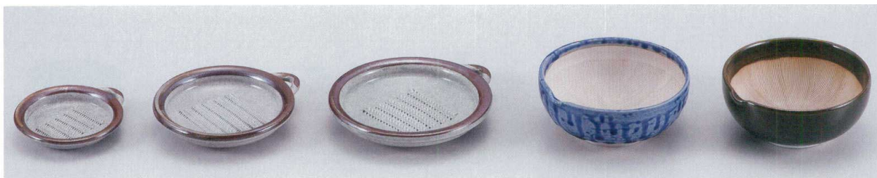
377-201-207 600円 梨地ミニオロシ皿 (10×1.9) 539120320 377-202-207 670円 梨地3.8オロシ皿 (12.4×2.5) 539120420 377-203-207 840円 梨地4.5オロシ皿 (14.3×2.5) 539120520 377-204-167 900円 口付丸型4.0スリ鉢(青イラボ) (11.6×4.8) 539020516 377-205-167 900円 口付丸型4.0スリ鉢(オリベ) (11.6×4.8) 539020416