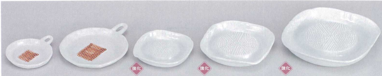
377-101-767 500円 白マット手付オロシ(小) (11×9×1.3) 639130176 377-102-767 750円 白マット手付オロシ(大) (16×13×1.6) 639130276 377-103-707 1,010円 ノンスリップおろし器小(白) (10.1×10.1×1.9) 539130471 377-104-707 1,660円 ノンスリップおろし器中(白) (13.5×13.5×2.2) 539130571 377-105-707 2,760円 ノンスリップおろし器大(白) (17.3×17.3×3.1) 539130671