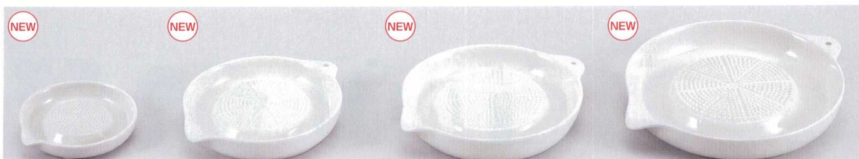
377-501-517 450円 おろし皿ミニ(1929-020) (9.8×9×2) 737750151 377-502-517 720円 おろし皿S(1936-030) (14.6×12.3×2.5) 737750251 377-503-517 880円 おろし皿M(1943-038) (16.5×13.8×3) 737750351 377-504-517 1,250円 おろし皿L(1950-048) (20.8×17.5×3) 737750451