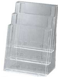
①カタログホルダー 3C230 (A4判3段) 22317 3857500 186×237×H340 材質:スチロール樹脂 A4判縦 厚み32mm