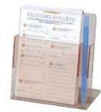
⑩えいむ ハガキアンケート スタンド CL-54 8399500 125×80(20)×H145 材質:エンビ