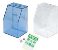
アクリル募金/提案箱 商品コード 16 594444BLU ブルー 3857360 19 594444CLR クリア 3857370 102×120×H185 シール付/「提案箱」「募金箱」 「応募箱」無地 ロックキー付き