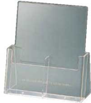
⑦パンフレットスタンド 2C-112 7634900 235×92×H250 (カタログ収納部:112×30) カタログサイズ:A4(3つ折)×2列 材質:透明スチロール一体成型