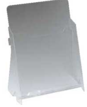
⑤カタログホルダー A190 (B5判) 42758 3857800 100×206×H255 材質:PET樹脂 B5判 厚み30mm