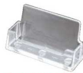
⑳名刺立て BC93 (横置き) 22312 3857700 32×101×H52 材質:スチロール樹脂 収納部サイズ/93×18