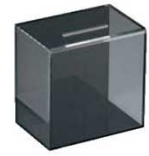
⑰えいむ アンケート・募金・ 応募ボックス ES-2 黒 2910900 外寸:147×100×H149 ※後方にカギがつけられます。