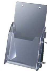
⑨アンケートスタンド A110 30802 3857200 140(110)×90(25)×H200 材質:PET樹脂 ※折りたたみペン立て付き。 ※壁掛使用可能。