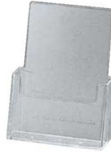
③カタログホルダー C230 (A4判) 22316 3857400 92×235×H250 材質:スチール樹脂 A4判縦 厚み30mm