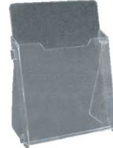
④カタログホルダー A230 (A4判) 30565 3857900 116×232×H286 材質:PET樹脂 A4判 厚み30mm