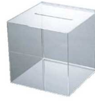
⑯応募箱 41434 3857300 200×200×H200 材質:アクリル樹脂 投入口:10×130