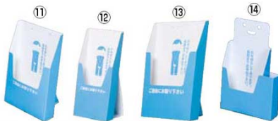
ペーパーリフスタンド