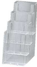
②カタログホルダー 4C110 (A4判3つ折4段) 22315 3857600 203×110×H255 材質:スチロール樹脂 A4判三つ折 厚み32mm