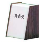
㉓木目 貴名受 KU3200-2 0772400 外寸:122×98×H84 材質:エンビ/アクリル