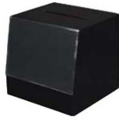
⑮アンケートBOX 52562 3857350 155×150×H150 材質:PVC樹脂 ●守秘義務を守るために外からは一切見えないブラックで統一(個人情報保護等) ●ロック用の穴が空いていますので情報流出を防止します