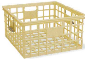
PPE95-01 イエロー ¥7,000

外側寸法:390×370×194H 有効寸法:352×330×185H 重さ:(A95)1,040g (A95h(取っ手付))1,140g 一梱数:8個