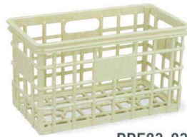
PPE93-03 グリーン ¥5,000