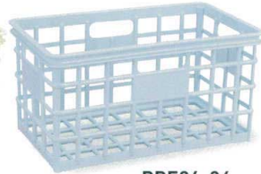
PPE94-04 ブルー ¥5,350