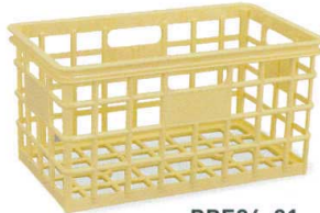
PPE94-01 イエロー ¥5,350

外側寸法:370×219×191H 有効寸法:335×186×181H 重さ:695g 一梱数:12個