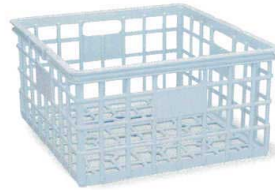
PPE95-04 ブルー ¥7,000