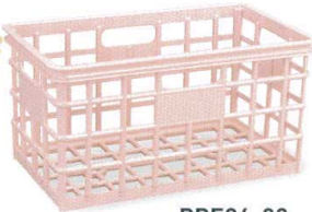
PPE94-02 ピンク ¥5,350