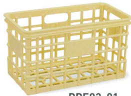
PPE93-01 イエロー ¥5,000

外側寸法:340×185×192H 有効寸法:308×153×180H 重さ:630g 一梱数:12個