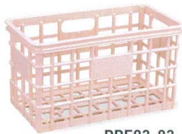
PPE93-02 ピンク ¥5,000