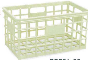
PPE94-03 グリーン ¥5,350