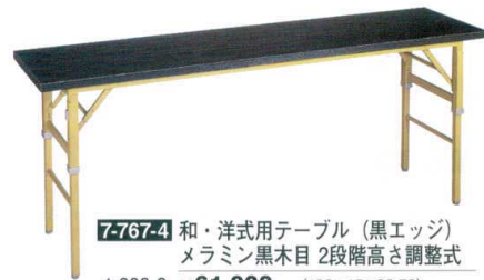
7-767-4 和・洋式用テーブル (黒エッジ) メラミン黒木目 2段階高さ調整式