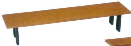
7-767-1 新宴会机メラミンチーク (ABS折足) A-2-36 ¥37,500 (180×43×32.5)