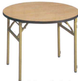
シナベニヤ (ソフトエッジ・バネ式脚)