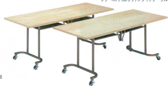
シナベニヤ (木ブチ) フライトテーブル