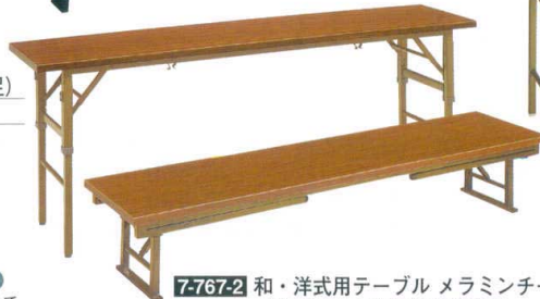
7-767-2 和・洋式用テーブル メラミンチーク (共ブチ) 2段階高さ調整式