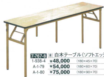
7-767-8 白木テーブル (ソフトエッジ)