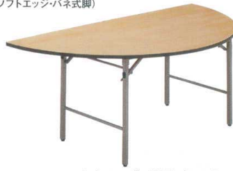
7-767-7 白木テーブル半月 (ソフトエッジ)