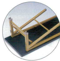
2段階高さ調節式 足は折りたたみ式になっており、高さが33cmと70cmに調整できます。