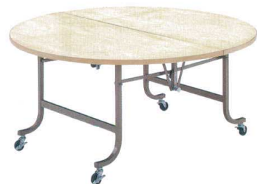
7-767-9 白木フライトテーブル丸 (木ブチ)