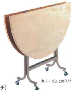
丸テーブルの折りたたみ図