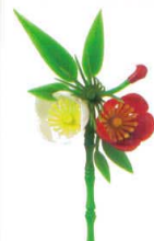
J8-77-9 H-156-43 松竹梅 (小) (6×10.8) 2g (50本入) ¥1,850