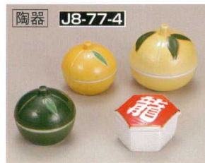
陶器 J8-77-4 H-152-77 新ゆず型珍味入 (5.5φ×5.2) 86g H-11-42 ゆず珍味 限定品 (6.8φ×6.5) 130g ¥480 ¥600 H-152-78 新ゆず型珍味入 (緑) (5.5φ×5.2) 92g H-152-79 龍鳳亀甲珍味入 (5×6×3.3) 80g ¥480 ¥550