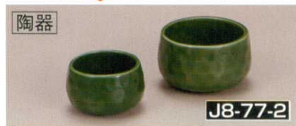
陶器 J8-77-2 H-152-70 緑釉三ツ足珍味入 (小) (4.7φ×2.9) 32g H-152-71 緑釉三ツ足珍味入 (大) (6φ×3.7) 49g ¥380 ¥480