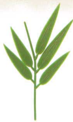
J8-77-6 H-156-40 笹の葉 (中) (6.5×10.8) 1g (100本入) ¥1,450