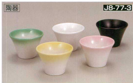
陶器 J8-77-3 H-152-72 羽反丸型珍味入 ヒワ吹 (5.7φ×4) 46g H-152-73 羽反丸型珍味入 白 (5.7φ×4) 46g H-152-74 羽反丸型珍味入 黒マット (5.7φ×4) 46g ¥270 ¥250 ¥270 H-152-75 羽反丸型珍味入 黄吹 (5.7φ×4) 46g H-152-76 羽反丸型珍味入 ピンク吹 (5.7φ×4) 46g ¥270 ¥270