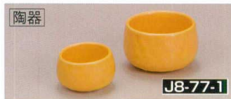
陶器 J8-77-1 H-152-68 黄釉三ツ足珍味入 (小) (4.7φ×2.9) 34g H-152-69 黄釉三ツ足珍味入 (大) (6φ×3.7) 68g ¥380 ¥480