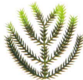
J8-77-7 H-156-41 立ちかずら (7×6.5) 0.8g (100本入) ¥4,000