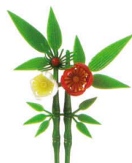
J8-77-15 H-156-49 新松竹梅 (赤) (8×10.5) 3g (50本入) ¥2,650