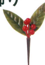
J8-77-8 H-156-42 千両 (6.3×9.5) 3g (50本入) ¥3,100