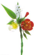
J8-77-10 H-156-44 寿付松竹梅 (小) (6×10.8) 2g (50本入) ¥1,950