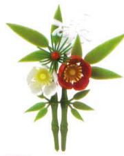
J8-77-11 H-156-45 寿付新松竹梅 (8×10.5) 3g (50本入) ¥2,750