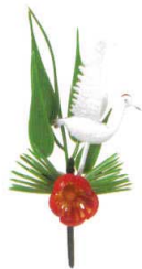
J8-77-14 H-156-48 つる付松竹梅 (5.5×11.5) 3g (50本入) ¥3,100