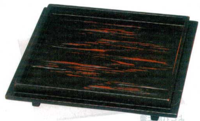
3-1139-5 ¥7,000 木製6.5寸正角能舞台盛台 曙 困 燻木 200×200×42 2-1349-4 (55006880)