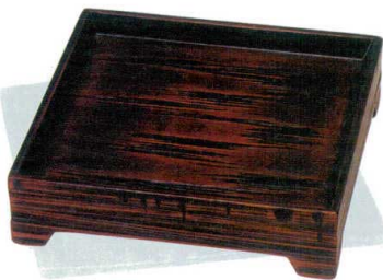
3-1139-3 ¥7,800 木製6寸正角象足盛器 栃 困 8 燻木 183×183×47 2-1349-2 (55006860)