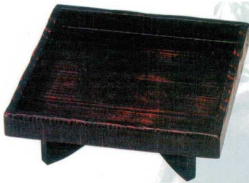
3-1139-1 ¥9,000 木製6寸荒彫正角組脚盛器 曙 困 180×180×60 2-1349-1 (55006850)