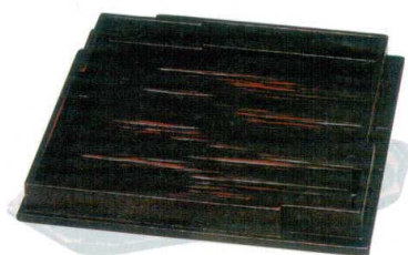
3-1139-10 ¥8,400 木製6.5寸正角槽盛器 曙 困 燻木 190×190×30 2-1347-2 (55006740)