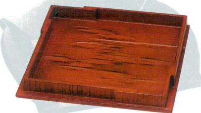
3-1139-11 ¥8,400 木製6.5寸正角槽盛器 根来 困 8 燻木 190×190×30 2-1347-3 (55006750)