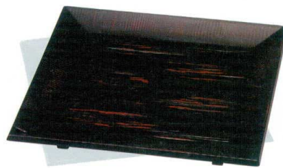
3-1139-7 ¥9,000 木製7寸正角高千穂盛台 曙 困 燻木 210×210×34 2-1349-6 (55006900)