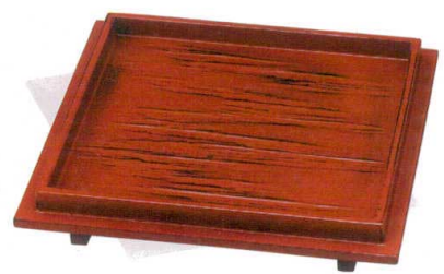
3-1139-8 ¥7,000 木製6.5寸正角能舞台盛台 根来 困 燻木 200×200×42 2-1349-7 (55006910)