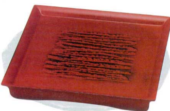
3-1139-9 ¥7,800 木製6寸正角御殿盛器 根来 困 8 燻木 180×180×30 2-1347-1 (55006730)