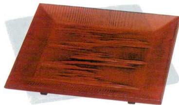
3-1139-4 ¥8,400 木製6寸正角高千穂盛台 根来 困 燻木 183×183×34 2-1349-3 (55006870)