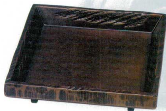
3-1139-2 ¥7,700 木製6.5寸荒彫正角高台盛器 よもぎ 困 207×207×50 2-1348-7 (55007000)