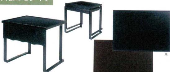
10-14-19 曲げ木天板のセタイプ一人膳 ¥ 29,000 (W740・D550・H610) 脚部曲木成形ですので組立式にくらべ強度があります。