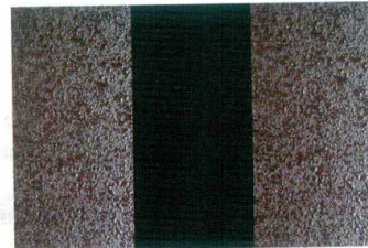
10-25-1 ハードコーティングうるみ乾漆 黒鏡面おび