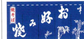
関西風仕立 (袋仕立)