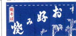
関西風仕立 (袋仕立)