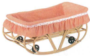
※ 10-39-1 ヨーラン車輪付 フリル付 ¥ 73,500 (W1,130・D590・H570)