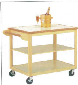
10-39-17 サービスワゴン ¥ 98,000 (W750・D550・H620) フレーム色/白木・ケヤキ色・黒