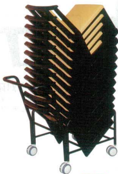
10-39-6 組立 スチール台車 黒 手付 ¥ 58,000 スチールメラミン焼付塗装

10-29-1タイプで 10脚まで積む事が出来ます。 台車単体の時はコンパクトに収 納出来ます。