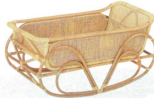
※ 10-39-3 ヨーラン フリル付 ¥ 70,200 (W1,100・D590・H570)