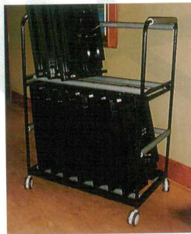
10-39-7 一人膳用台車 ¥ 110,000 (W1,220・D600・H1,420) スチール