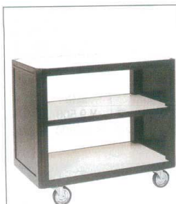
10-39-16 サービスワゴン ¥ 85,000 (W750・D550・H620) フレーム色/白木・ケヤキ色・黒