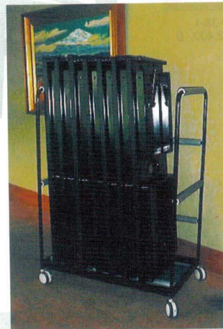
10-39-8 二人膳用 縦型台車 ¥ 94,500 (W1,060・D600・H1,420) スチール