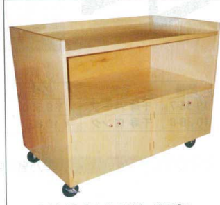
10-39-19 特大サイドボードワゴン ¥ 290,000 (W1,200・D550・H900) 桧突板