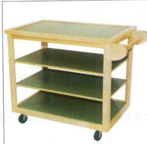
10-39-18 サービスワゴン ¥ 150,000 (W860・D620・H850) フレーム色/白木・ケヤキ色・黒