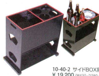
10-40-2 サイドBOX黒天朱 ¥ 19,200 (W430・D280・H380)