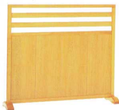
10-40-7 妙義 白木和風型 S型 ¥ 76,300 (W1,200・D280・H1,050)