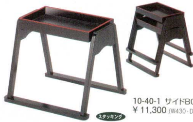
10-40-1 サイドBOXスタッキングタイプ ¥ 11,300 (W430・D220・H370)