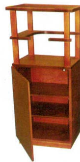
10-40-3 ポットワゴン ケヤキ ¥ 97,500 (W480・D350・H1,090)