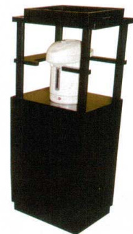
10-40-4 ポットワゴン 黒 ¥ 97,500 (W480・D350・H1,090)