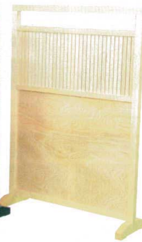
10-40-10 長良 白木 ¥ 89,000 (W900・D300・H1,300)