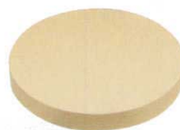
⑧ 中華用 抗菌プラまな板 (AMN-57)

従来のプラスチックまな板のように、たたくとも庖丁がはずみません。しかもはがせる構造(一層9mm厚)で経済的。木を超えた、中華専用まな板の決定版です。 ※返品は御遠慮ください。