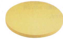
⑨ ゴム 中華まな板 (AMN-36)