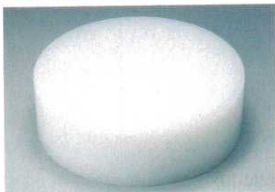
① 住友 プラスチック中華まな板 (AMN-31)