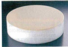
⑤ 積層 プラスチック カラー中華まな板 ベージュ (AMN-A6)

●底に色付 ※厚さ103mmは8回(10mmごと)、153mmは13回はがせれます。