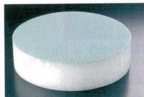
④ 積層 プラスチック カラー中華まな板 ブルー (AMN-A5)