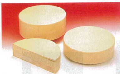
⑦ 抗菌性ラバー・中華まな板 (AMN-49)

●底に色付 ※厚さ103mmは8回(10mmごと)、153mmは13回はがせれます。