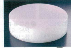
⑥ 積層 プラスチック カラー中華まな板 ピンク (AMN-A4)

●底に色付 ※厚さ103mmは8回(10mmごと)、153mmは13回はがせれます。