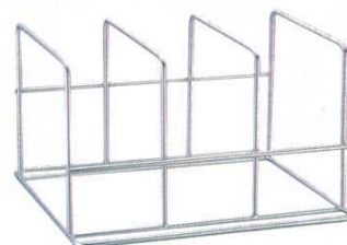
⑩ Ω 18-8 中華まな板立 TT-3 (AMN-94) 5-0309-1001 ¥25,000 517×453×H310 適応サイズ:φ400~φ500 厚さ150mmまで ●中華まな板が3枚まで立てられます。