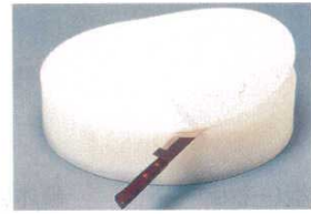
③ 積層 プラスチック 中華まな板 (AMN-33)