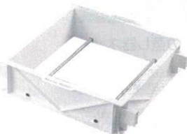
⑫ FRPセイロ2型 〈ASI-20〉

外寸:500×462×H120 内寸:402×402×H100 ごはんの容量:約3升 ※ステンレス・サン付 ※角セイロ用竹スタレ39cm用・ Ω18-8クリン目セイロ網39cm用 が合います。 ※蓋は⑤⑥角セイロ36cm用が合います。