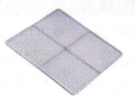
⑬ Ω18-8クリン目 セイロ網(11mm目) 〈WSI-17〉

5-0339-1201 ¥11,240 外寸:495×464×H85 内寸:404×404×H65 ごはんの容量:約2升 ※ステンレス・サン付 ※角セイロ用竹スタレ39cm用・ Ω18-8クリン目セイロ網39cm用 が合います。 ※蓋は⑤⑥角セイロ36cm用が合 います。