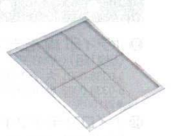
⑭ Ω18-8セイロ網 (6.5メッシュ) 〈WSI-04〉