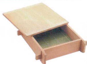
① 木製 角セイロ 関東型(サワラ材)〈WSI-01〉