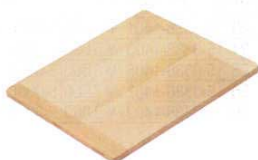
⑤ 木製 角セイロ用 スリ蓋(サワラ材) 〈WSI-06〉