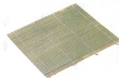
③ 木製 角セイロ用 竹スタレ 〈WSI-03〉