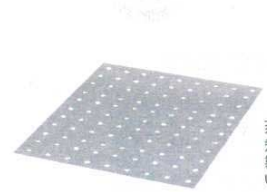
⑮ 業務用両面シリコンペーパー リンベシートの角型・穴目 〈ASL-53〉