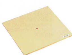
⑨ 高機能 角セイロ用台す 〈WSI-14〉