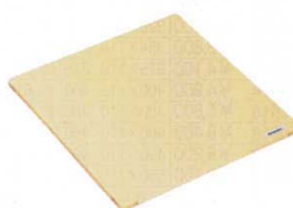
⑩ 高機能 角セイロ用平蓋 〈WSI-15〉