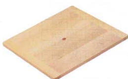
④ 木製 角セイロ用 台す (サワラ材) 〈WSI-07〉