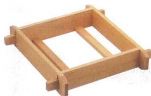
② 木製 角セイロ 浅口(サワラ材)〈WSI-02〉