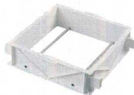
⑪ FRPセイロ型 〈ASI-19〉