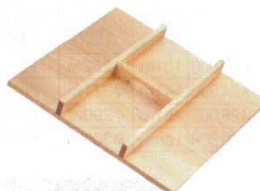
⑥ 木製 角セイロ用 手付蓋(サワラ材) 〈WSI-05〉