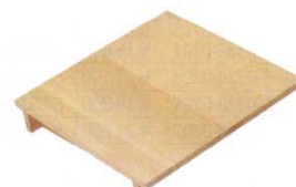
⑦ 木製 角セイロ用 傾斜蓋 (サワラ材) 〈WSI-08〉