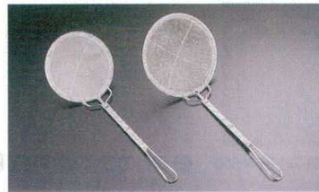
⑤ 18-8 手編式