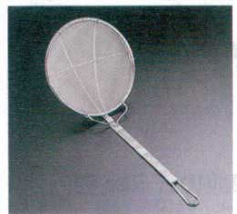
④ 18-8 プレス式