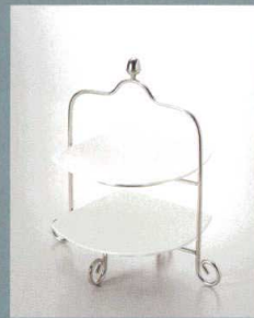
SK500-2 アミューズスタンド(2段) ¥5,000 L215・S215・H230mm CT/20 ※(5289)14cmスクエアプレート・(5354)14cmスクエアレリーフプレート(別売)が適合します。