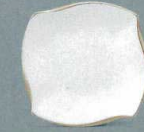
50554-5249 13(11)cmスクエアトレイ (プラチナ) ¥1,300