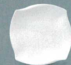
50460-5249 13(11)cmスクエアトレイ (白) ¥1,000 L110・S110・H15mm CT/36