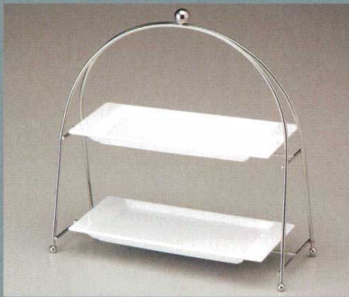
SK500-1 ブチケキスタンド(2段) ¥5,500 L262・S106・H265mm CT/24 ※(9753)21.5cmオブロングトレイ(別売)が適合します。