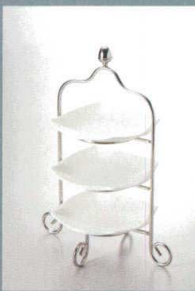
SK500-3 アミューズスタンド(3段) ¥5,000 L170・S170・H220mm CT/20 ※(5249)11cmスクエアトレイ(別売)が適合します。