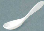
50576-9706 リーフ・スプーン ¥1,100 L162・S32・H22mm CT/100