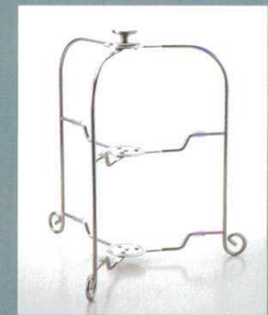
SK455-1 ワンタッチプレートスタンド ¥10,000 D310・H296mm CT/16 ※19~24cmのプレートが適合します。