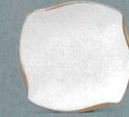
50461-5249 13(11)cmスクエアトレイ (金) ¥1,300