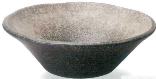
青窯肌手洗鉢 SA80-4 W345×H120 ¥25,000