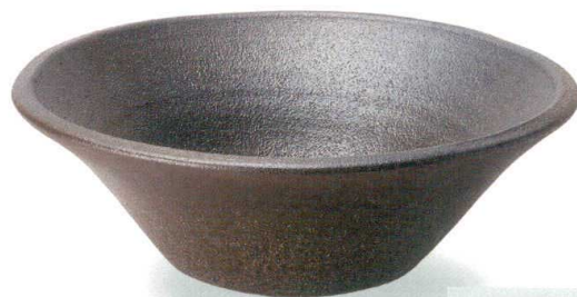
コゲ軸手洗鉢 SA80-5 W340×H120 ¥25,000