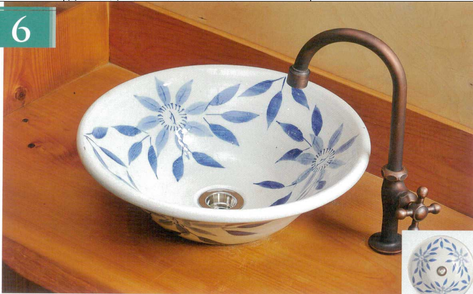
鉄線絵手洗鉢 SA80-1 W330×H110 ¥27,000