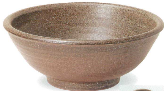
古窯手洗鉢 SA80-3 W360×H150 ¥25,000