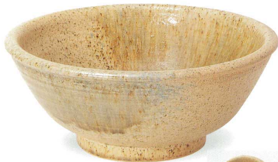
古陶三彩手洗鉢 SA80-2 W360×H150 ¥25,000