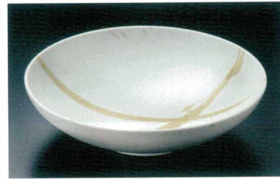
02211-577 白湧水メタ9.5鉢 2,700円 15入 (28.2×7.7cm)