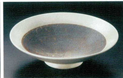
02216-057 楠錆9.0盛鉢 1,600円 18入 (28×7.7cm)