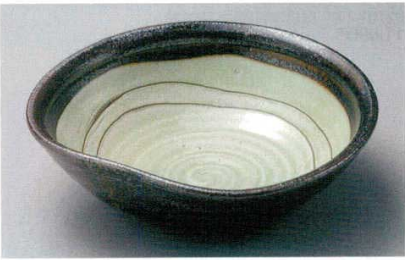
02207-107 粉引クシ目ひねり9.0平鉢 4,500円 15入 (27.2×26.8×9cm)