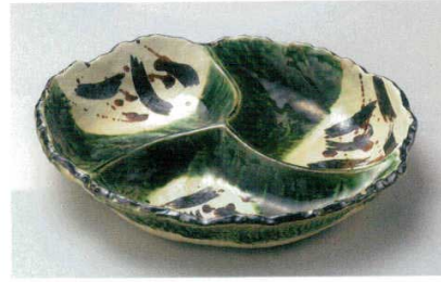
02208-177 織部三つ仕切9.0鉢 3,900円 20入 (27.4×25×4.5cm)