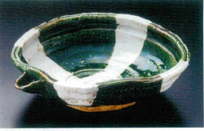
02203-177 織部剣先片口浅口大鉢 5,400円 12入 (29×24.8×7.5cm)