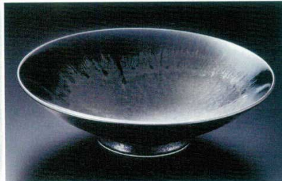
02217-177 織部9.0盛鉢 1,580円 20入 (28.7×7.7cm)