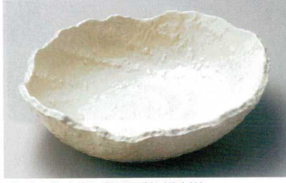
02213-647 白地うず潮9号盛鉢(萬古焼) 2,100円 16入 (27.5×24.2×7.3cm) 02214-647 白地うず潮8号盛鉢(萬古焼) 1,500円 26入 (25×22.3×5.5cm)