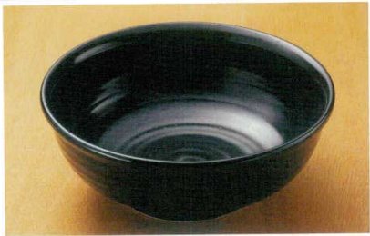
02201-177 ゆず黒玉淵9寸大盛井 9,800円 8入 (27.8×11.3cm)