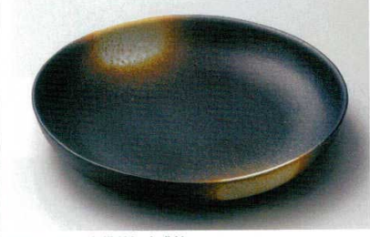
02209-527 京備前切立盛鉢 3,200円 10入 (29.5×4.9cm)