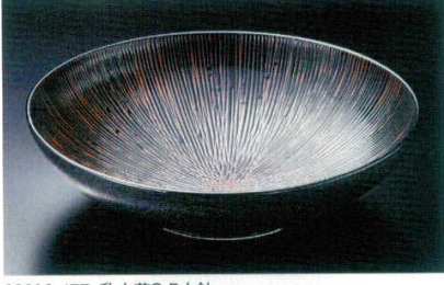
02210-477 乱十草9.5大鉢 2,700円 12入 (28.5×7.5cm)