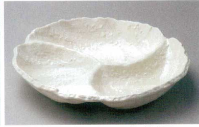
02212-647 白地うず潮三ツ切オードブル(萬古焼) 2,200円 16入 (27.8×25.7×5.3cm)