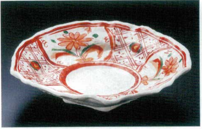
02202-187 赤絵間取9.0盛鉢 7,500円 10入 (27.5×27.5×7cm)