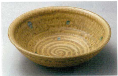
02206-107 黄瀬戸織部チョコボ9.0平鉢 4,800円 16入 (27.5×8.5cm)