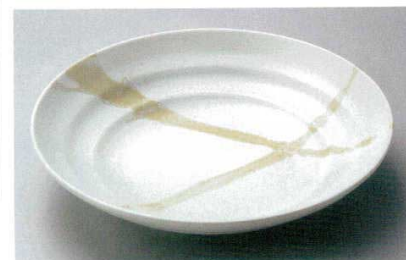
02215-577 白湧水捨り9.5盛鉢 1,800円 15入 (28.8×6cm)