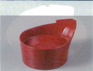
5-935-9 ¥1,200 回転寿司皿用船 赤 [A] 156×114×70 3-701-13 (74012330)