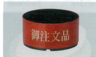
5-935-5 ¥800 回転寿司皿用W高台 朱金パール 御注文品 [A] φ120×61 3-701-6 (13000232)