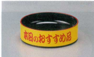
5-935-3 ¥650 回転寿司皿用高台 黄天朱 本日のおすすりめ品 [A] φ125×40 3-701-4 (13000229)