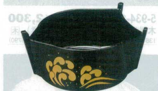
5-935-6 ¥1,750 回転寿司皿用高台舟 黒に波 [A] 158×122×67 3-701-10 (13000226)