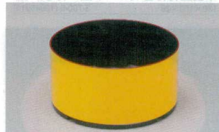
5-935-4 ¥700 回転寿司皿用W高台 黄天朱 (内黒) [A] φ120×61 3-701-5 (72020190)