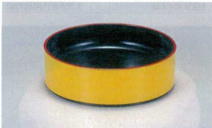
5-935-2 ¥600 回転寿司皿用高台 黄天朱内黒 [A] φ125×40 3-701-2 (70010400)