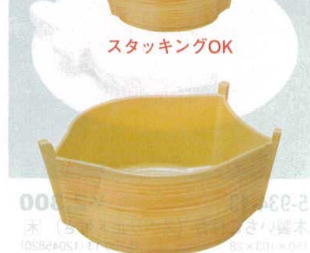
5-935-8 ¥1,500 回転寿司皿用高台舟 白木 [A] 158×122×67 3-701-12 (13000228)