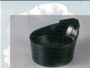
005-935-10 ¥1,200 回転寿司皿用船 黒 [A] 156×114×70 3-701-14 (74012340)