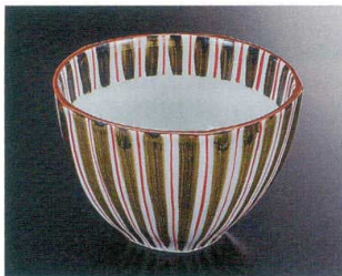
AT2-67-3 (直運) ￥2,600 錆十草 研五方鉢 陶 φ120×80 84111560