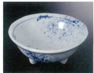
AT2-67-10 (直運) ￥1,700 吹き墨4寸三つ足小鉢 (有田焼) 陶 φ118×50 3-1271-4