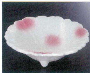
AT2-67-9 (直運) ￥2,200 白土マロンぼかし花型小鉢 (有田焼) 陶 138×126×43 3-1271-8