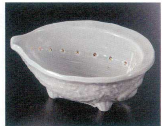
AT2-67-6 (直運) ￥4,000 鮑型小井グレー金 (有田焼) 陶 148×115×60 3-1269-4