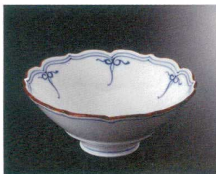
AT2-67-11 (直運) ￥1,750 淵櫻珞 (青) 桔梗淵高台中付 (有田焼) 陶 φ124×51 3-1269-6