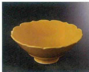
AT2-67-13 (直運) ￥1,550 黄釉 桔梗淵高台中付 (有田焼) 陶 φ124×51 3-1269-9