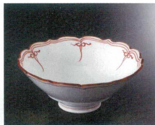
AT2-67-12 (直運) ￥1,750 淵櫻珞 (赤) 桔梗淵高台中付 (有田焼) 陶 φ124×51 3-1269-7