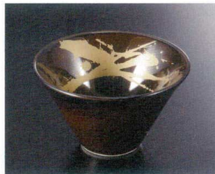
AT2-67-4 (直運) ￥2,950 飴釉金しぶきデザートカップ (有田焼) 陶 φ105×60 3-1271-2