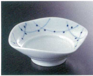
AT2-67-1 (直運) ￥2,400 五月青磁染付乱線点四方なぶり中付 (有田焼) 陶 124×124×48 3-1269-1