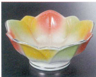
AT2-67-7 (直運) ￥2,100 淵プラチナ三色ぼかし (赤) 小鉢 (有田焼) 陶 φ125×54 3-1271-6