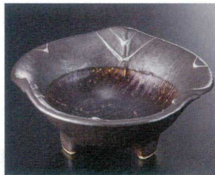
AT2-67-5 (直運) ￥3,000 黒土角地紋布目三方切小鉢 (有田焼) 陶 136×126×56 3-1271-3