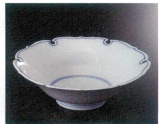
AT2-67-14 (直運) ￥1,550 見込筋 雪輪型浅小鉢 (有田焼) 陶 φ139×44 3-1269-10