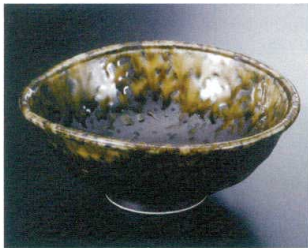
AT2-67-2 (直運) ￥2,150 錆締灰釉 片しほり鉢 (有田焼) 陶 132×123×54 3-1269-2