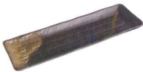
⑩ 吹き流しさんま付け出し

[SMYC-02] 12-0904-0901 ¥1,290 サイズ:205×105×H20