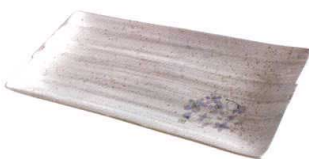
⑭ 紫桜合せ角ほっけ皿

[SMYC-06] 12-0904-1301 ¥2,250 サイズ:310×165×H25