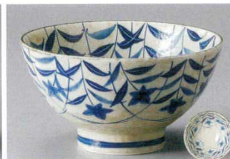
418-18-434 850円 淡桔梗5.8めん鉢 (17.8×9.5cm)