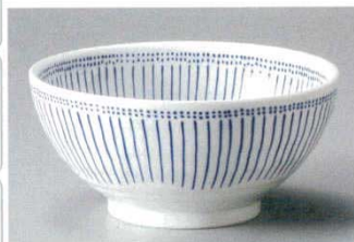
418-09-244 800円 点十草さぬき丼 (18.5×9cm)