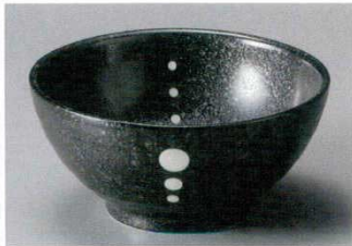
418-03-454 850円 ドット黒マツさぬき丼 (18.8×9cm)