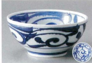
418-07-494 830円 藍草紋さぬき丼 (18.5×8.9cm)