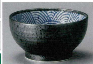
418-13-464 1,380円 青海波釜上丼 (17×8.8cm)