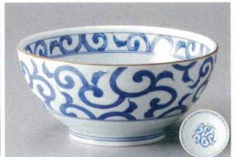
418-12-454 780円 花唐草さぬき丼 (18.8×9cm)