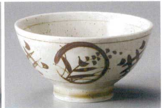
418-20-434 850円 ひだ路5.8めん鉢 (17.8×9.5cm)