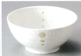
418-11-464 800円 ドットさぬき丼(白) (18.5×9cm)