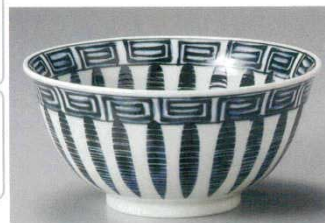
418-17-494 880円 雷門十草深口丼 (18×6.8cm)