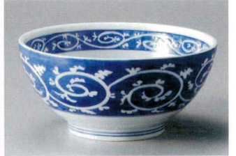
418-08-494 830円 ダミタコ唐草さぬき丼 (18.8×9cm)