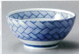
418-05-494 830円 網代紋さぬき丼 (18.5×9cm)