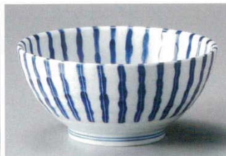
418-10-244 800円 濃十草さぬき丼 (18.5×9cm)