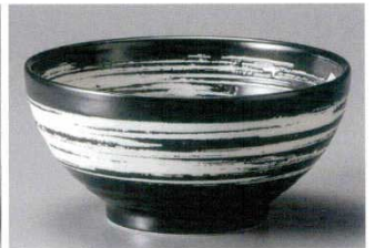
418-16-674 980円 黒釉刷毛目うどん丼 (18.8×9cm)