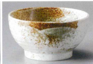
418-15-564 1,150円 雪志野5.5釜上丼 (17×8.8cm)