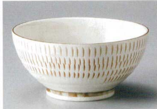
418-06-494 830円 飛び鉦釜あげ丼 (18.5×9cm)