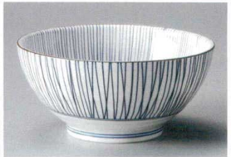
418-04-464 840円 細十草さぬき丼 (18.5×9cm)