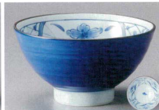
418-19-434 850円 紺巻里の秋5.8めん鉢 (17.8×9.5cm)