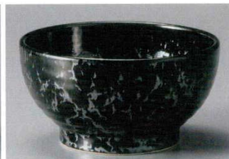
418-14-644 1,150円 黒真珠5.5釜上丼 (17×9cm)